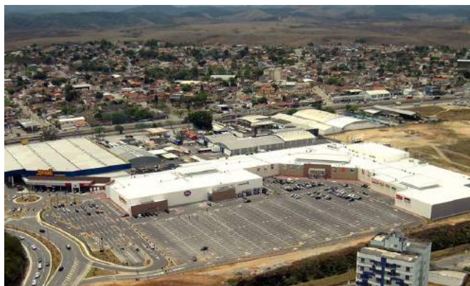
Figura 8 – Vista aérea do complexo com o shopping center Pátio Mix e o hipermercado Spani, localizado junto ao principal acesso viário de Resende e à Rodovia Presidente Dutra (acima do hipermercado). Sem data.

Já no entroncamento da rodovia Presidente Dutra com principal acesso viário ao município de Resende, foi instalado o hipermercado Spani (2008) e, posteriormente, construído o shopping center da rede fluminense Pátio Mix (2011), esse sendo de médio porte e tendo múltiplos usos. Esses empreendimentos formam conjuntamente uma centralidade comercial (Figura 8).