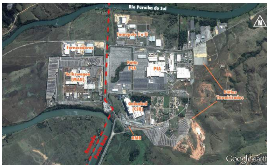
Figura 6 – Imagem aérea do polo industrial de Porto Real, com indicação das principais indústrias e do limite entre os municípios de Resende e Porto Real, 2014. Edição a partir de imagem do Google Earth Pro em Bentes (2014).

Nesse sentido, observa-se que as novas indústrias implantadas nos municípios de Porto Real (Figura 6), Resende e Itatiaia (Figura 7) seguem a tendência de se concentrarem geograficamente em polos industriais, com o objetivo de reduzir custos e gerar maior produtividade. Esse agrupamento de empresas e indústrias facilita o encadeamento com as demais empresas e fornecedores, possibilitando a reunião da mão de obra e de suprimentos, como a também maior rotatividade de estoques e da produção. Esses polos levam à formação de novas centralidades.