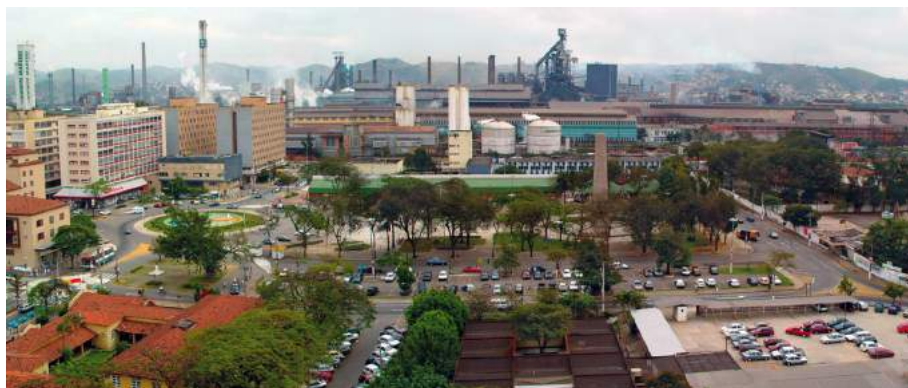
Figura 3 – Volta Redonda: vista da Vila Sta. Cecília (Centro Comercial) e da CSN (Alts-fornos), em uma mesma Unidade Espacial.

Essa dinâmica regional foi alterada com a privatização da CSN em 1993. Este fato marcou a reestruturação produtiva e econômica do Vale do Paraíba fluminense, com rebatimentos no espaço regional. Em meados dos anos 1990-2000, após a privatização da CSN e uma grave crise social e econômica, essa região começou a se reestruturar produtiva e espacialmente, com a sua reindustrialização. Novas indústrias começaram a ser implantadas nos municípios de Resende, Porto Real e Itatiaia, esses dois últimos emancipados em 1995 e 1988, respectivamente. Essas plantas industriais se relacionam, sobretudo, ao setor metalomecânico – que inclui a indústria automobilística.