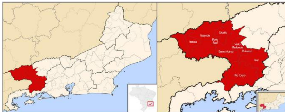
Figura 2 – Mapa do Estado do Rio de Janeiro com a microrregião do Vale do Paraíba Fluminense, tendo, à direita, os municípios da microrregião.

A microrregião tem uma população estimada, em 2017, de cerca de 705 mil habitantes e é formada por nove municípios (Figura 2), sendo três deles cidades médias: Volta Redonda, com população estimada de 265 mil habitantes; Barra Mansa, com 179 mil; Resende, com 127 mil habitantes. Os demais seis municípios são: Itatiaia, Pinheiral, Piraí, Porto Real, Quatis e Rio Claro 2 .