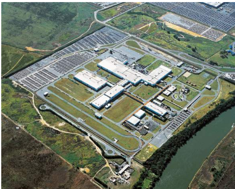
Figura 4 – Vista aérea da fábrica da Volkswagen em Resende, atual MAN Latin America. Sem data. A planta industrial foi inaugurada em 1 de novembro de 1996.