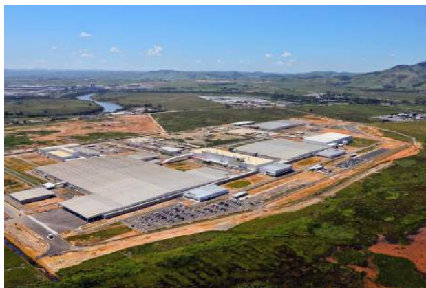
Figura 5 – Vista aérea da fábrica da Nissan em Resende, 2014.

Em 2014, foi instalada no leste desse município a fábrica de automóveis da nipó-francesa Nissan (Figura 5), com 22 ha de área construída 13 e ocupando um terreno de 300 ha, que foi comprado pelo estado do Rio e doado à montadora, que escolheu o local. Essa indústria localiza-se próxima ao polo de Porto Real e tem sua produção associada à linha de montagem instalada na planta industrial da Renault em São José dos Pinhais (PR).