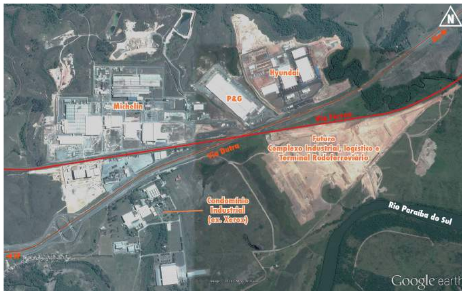
Figura 7 – Imagem aérea do polo industrial de Itatiaia, com indicação dos principais empreendimentos e vias. 2014. Edição a partir de imagem do Google Earth Pro em Bentes (2014).

Os empreendimentos industriais funcionam como catalisadores do processo de ocupação e organização do território regional, como observado ao logo do trabalho. Essas indústrias contam com mão de obra qualificada e de salários mais altos, características da atividade industrial que possuem o efeito de atração e multiplicação das atividades comerciais, de serviços e residenciais na microrregião, gerando, inclusive, novas centralidades. Essas atividades também são articuladas pela lógica do espaço de fluxos e apresentam características do processo de dispersão urbana (BENTES, 2014).