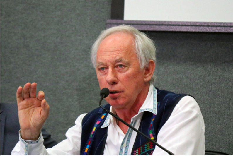
Prof. Carlos Minc Baumfeld participando do “Encontro dos ex-ministros de Estado do meio ambiente” no Instituto de Estudos Avançados da USP – maio/2019.