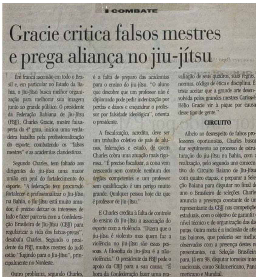
Figura 6 – Gracie critica falsos mestres e prega aliança no jiu-jítsu