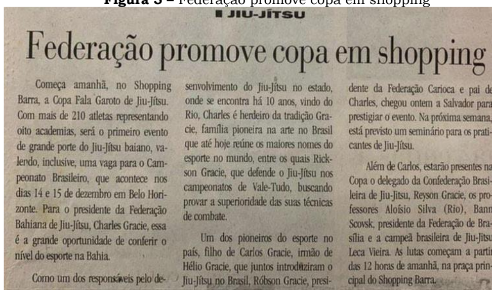
Figura 5 – Federação promove copa em shopping