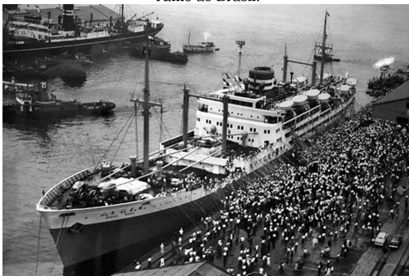
Figura 1 – Emigrantes japoneses embarcam no navio Kasato Maru em Kobe (Japão) rumo ao Brasil.

Jiu-Jitsu Brasileiro tem uma história recente, um processo que se iniciou a partir de migrações japonesas para o Brasil, no início do século XX, especificamente a partir da chegada de mestres oriundos da escola Kodokan mundialmente conhecida por ser a escola de Jigoro Kano reconhecido como o pai do Judô. Nunes e Rúbio (2013) afirmam, a partir de um estudo sobre a influência japonesa na formação e no desenvolvimento do Judô Brasileiro, que a prática dessas lutas no Brasil acontecia primordialmente nas colônias japonesas e eram formas de manutenção dessa cultura no país. Este estudo citado, ainda, aponta que o Judô Brasileiro surgiu dentro das colônias e comunidades japonesas que se estabeleceram a partir de 1908, com a chegada de Kasato Maru.