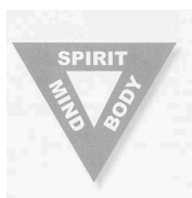
Figura 1. Triângulo vermelho que tornou-se símbolo da YMCA.

Estas diretrizes baseadas no trinômio “corpo”, “mente” e “espírito”, foram mais amplamente difundido como base da instituição a partir de 1891 com a iniciativa do professor Luther Gulick, da YMCA Springfield (EUA) que idealizou o símbolo triangular vermelho apontando as três partes do ser humano: alma, corpo e mente. Este símbolo é mundialmente conhecido como a identificação da YMCA, expressando suas bases de trabalho.