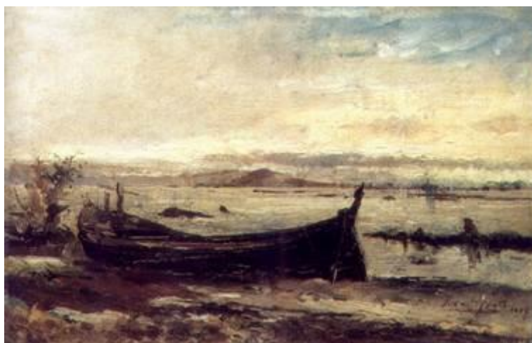
Vista do porto de Maria Angu tirada da Penha no Rio de Janeiro. Giovanni Battista Castagneto, 1887. Óleo sobre tela, 24 × 26 cm

A Praia de Maria Angu foi, durante décadas, de grande importância para o Rio de Janeiro. Por lá havia trapiches pelos quais se escoava a produção agrícola e industrial para a área central da cidade. Pereira Passos, na primeira década do século XX, chegou a melhorar o porto da região, estabelecendo inclusive uma ligação por barcas com a Praça XV.