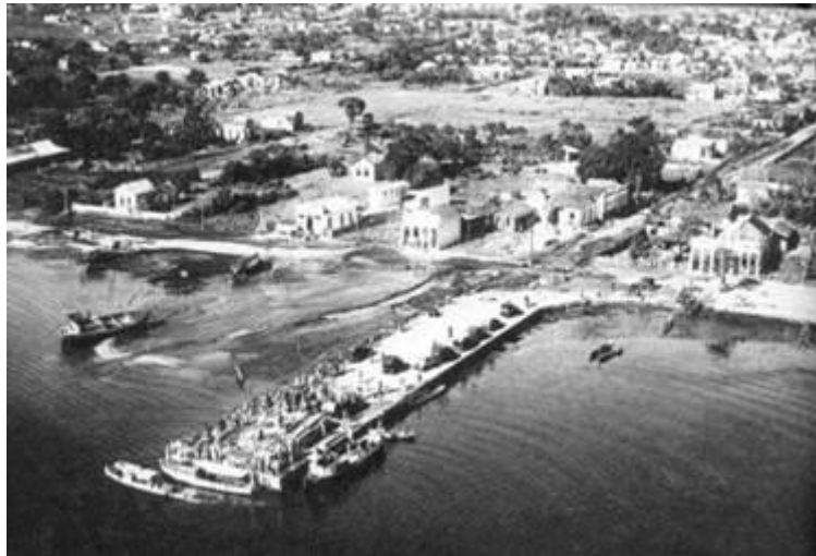
Porto na Praia de Maria Angu. Augusto Malta. Acervo George Ermakoff.

Nos dias de hoje, seria difícil visualizar essa parte do litoral em função das obras de aterro e de construção da Avenida Brasil. No mapa a seguir, temos uma noção do espaço. Atualmente, há no local algumas unidades da Marinha e uma favela.