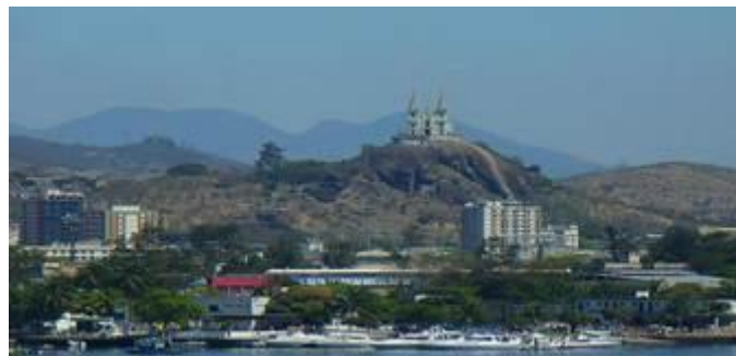
Bela visão do Carioca Iate Club.

Em vermelho, o Iate Clube de Ramos. Em azul, o Carioca Iate Clube. Em verde, o aeroporto internacional. Em marrom, a UFRJ.