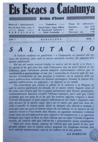
Imagen 1: Revista El Ajedrez Español Imagen 2: Revista Els Escacs a Catalunya

El objeto de estudio del presente artículo trata las primeras revistas de ajedrez publicadas en España. Concretamente se han analizado tres publicaciones [tabla 1]: