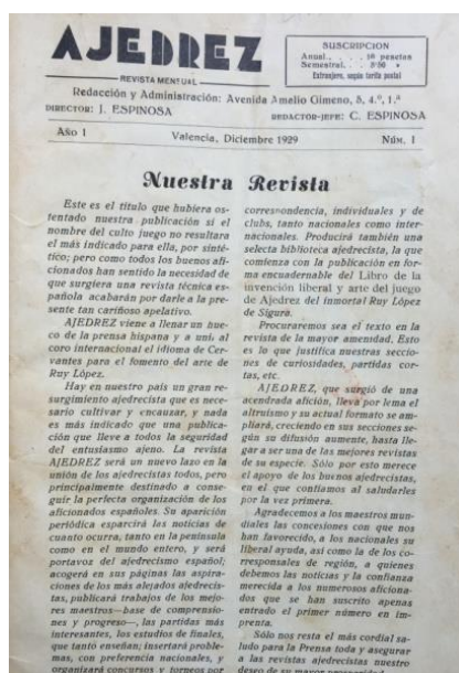
Imagen 6: Revista Ajedrez

Garzón, Alió y Artigas (2012) hacen notar que la revista tiene sus antecedentes en el Torneo Internacional de Barcelona de 1929 donde se encontraron los mejores ajedrecistas españoles de la época. Además la revista llevaba una separata en cada número de la obra de Ruy López, El libro de invención liberal y arte del juego del ajedrez . Asimismo, la revista fue portavoz de la Federación Española. Marín, como presidente publicaba las informaciones más relevantes en torno a esta organización.