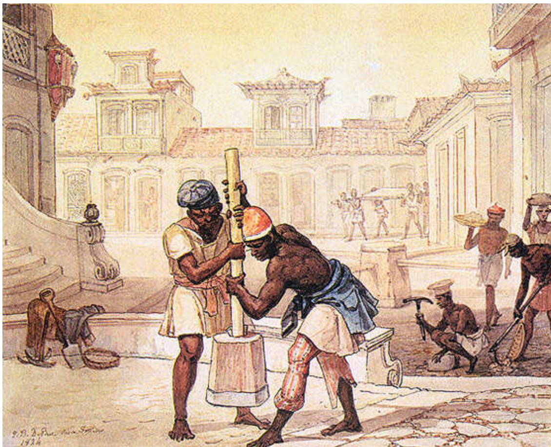
FIGURA 2 - CALÇAMENTO DE RUA FEITO POR ESCRAVOS

(DEBRET, Jean Baptiste. Negros Calceteiros . Aquarela sobre papel, 1824 Museu Castro Maya). Nesta aquarela, o viajante francês Debret – que compôs a comitiva artística que acompanhou a Família Real para o Brasil – registrou o emprego de escravos nas obras públicas. Ainda que essa prática fosse difundida, a necessidade em transformar o Rio na nova sede do poder português aumentou o número de escravos que trabalhavam para o poder público da cidade.