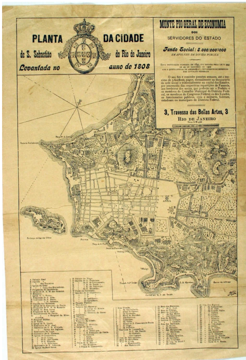
MAPA 1 - PLANTA DA CIDADE DO RIO DE JANEIRO EM 1808

espaço urbano, a escolha dos termos imundice e insalubridade não parecia exagerada para descrever o Rio de Janeiro de 1808.