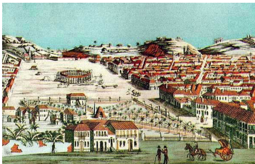
FIGURA 1 - O CAMPO DE SANTANA NO RIO DE JANEIRO

Outra obra que se desdobrou na expansão do perímetro urbano do Rio foi a ocupação do Campo de Santana. 20 Ainda em 1811, o Campo passou a abrigar o Quartel Militar, que comportava o Palacete do Campo (construído em 1813), o Jardim do Palacete e a Arena Militar, projetada para a realização de danças, jogos e até mesmo cavalhadas. 21 Os espaços até então reservados para as atividades militares (o Largo do Carmo e o Largo do Paço) não eram mais suficientes, tendo em vista a importância que o Rio de Janeiro passou a ter a partir de 1808. Sendo assim, era fundamental criar um local adequado para as práticas militares e festividades de uma cidade-Corte. Alguns anos mais tarde, o Campo de Santana abrigou a nova sede do Senado da Câmara, reforçando o interesse das autoridades em transformar este em mais um locus de poder na cidade que crescia.