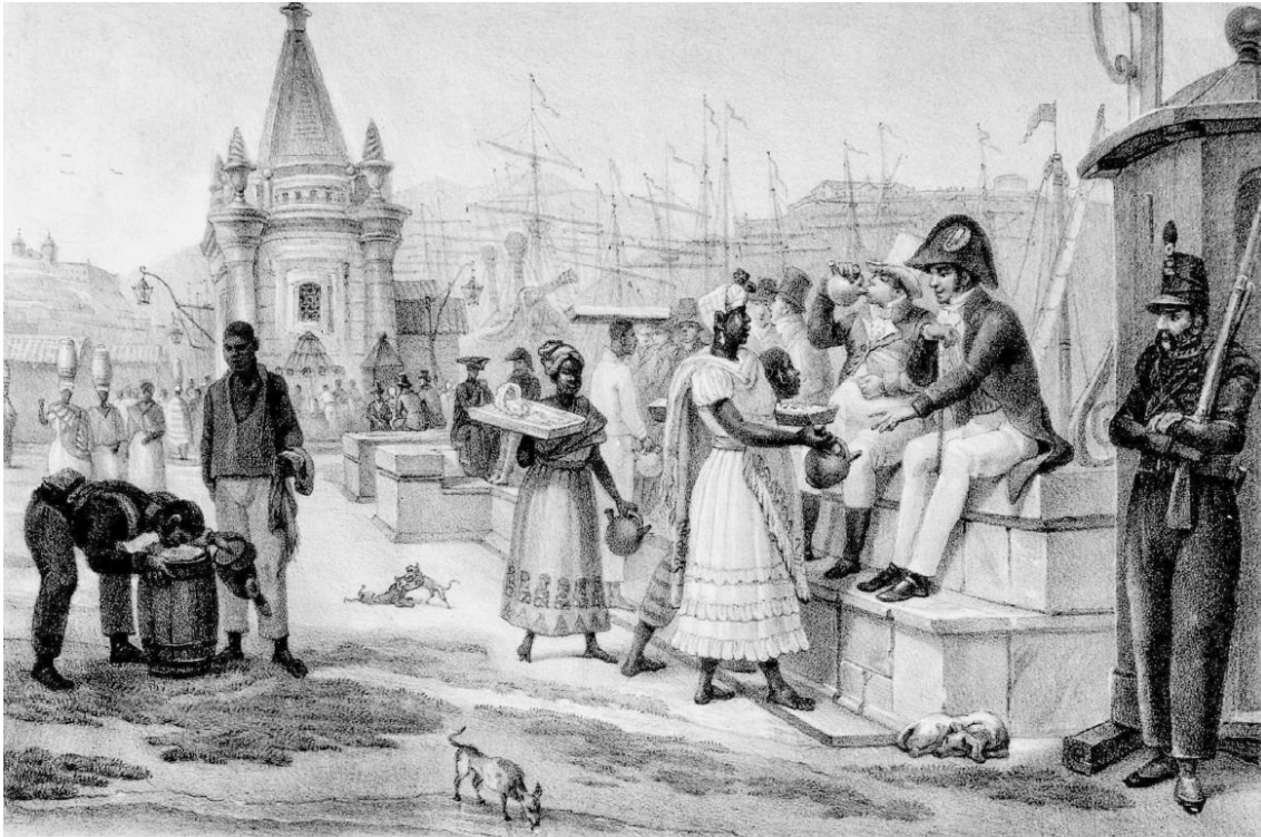
FIGURA 3 - ESCRAVOS TRABALHANDO NA REGIÃO PORTUÁRIA DO RIO

(DEBRET, J. B. Refreshment in the Largo do Paço, depois do Jantar . In: DEBRET, J. Viagem pitoresca e histórica ao Brasil . Vol. 2, prancha 9). Nesta litogravura, Debret registrou parte da diversidade de trabalhos que eram executados por escravos no Rio de Janeiro. Na imagem, que retrata o Largo do Paço, uma das regiões maior importância econômica e política da cidade, é possível observar escravos carregando mercadorias ao fundo, bem como cativas vendendo refrescos para homens que, aparentemente, também trabalhavam na região.