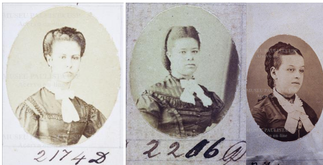
Imagens 9, 10 e 11: s/ título, 1870-1874 / 1872 / 1880. Papel albuminado, monocromia, 2,5 x 3 cm / 2,5 x 3 / 4,5 x 5 cm.

modelar – primeiro consubstanciada em retratos da família nuclear e, depois, em retratos de crianças. Mais uma vez, a ocupação do espaço da cena, a disposição dos sujeitos retratados, a maneira como estes se apresentam e miram a câmera desenham um universo de referências partilhadas.