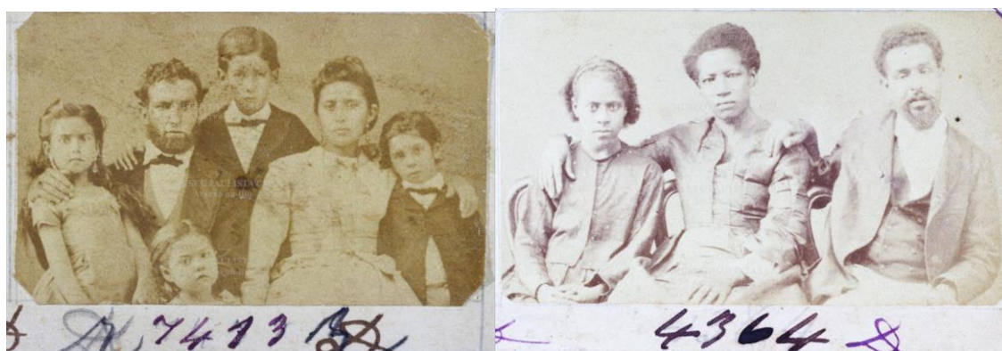
Imagens 12 e 13: s/ título, 1873 / 1875. Papel albuminado, monocromia, 5,1 x 3 cm.