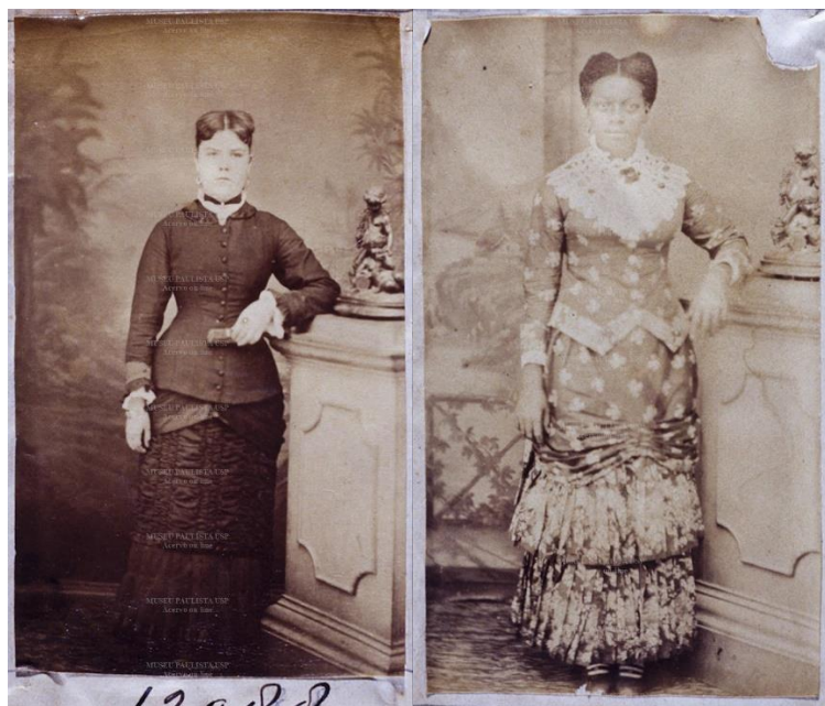
Imagens 7 e 8: s/ título, 1883. Papel albuminado, monocromia, 5,5 x 9 cm.

Essa espécie de citação que as imagens e seus protagonistas fazem uns aos outros pode ser capturada ao comprara-se ainda muitas outras fotografias da coleção, as quais, embora de forma menos mimética, igualmente atestam o uso circular das convenções do retrato oitocentista e seus signos de classe por sujeitos brancos e negros. É o que se nota ao comparar-se, por exemplo, o busto da ama de leite – ou ama seca, ou mulher liberta – do início do texto com tantos outros retratos de mulheres brancas e negras produzidos no mesmo estúdio e mesma época, como os que se vê abaixo (imagens 9 a 11): fundo neutro, pose inclinada, semblante circunspecto, apuro das vestes parecem-se o bastante para que se possa reconhecer uma linguagem visual comum.