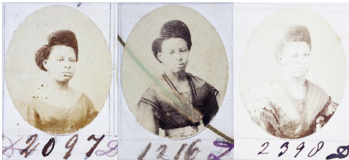
Imagens 2, 3 e 4: s/ título, 1870-1874. Papel albuminado, monocromia, 2,5 x 3 cm.

Retomemos a imagem que abre o texto, ou, mais precisamente, a mulher negra que está em seu centro. Ela surge em outros três retratos produzidos nas mesmas circunstâncias apenas parcialmente conhecidas: mesmo período, mesmo estúdio, mesmo fotógrafo, mesma pessoa. Desta vez, vê-se a mulher desacompanhada da criança, ocupando exclusivamente o centro e as atenções das imagens. Num dos casos, as roupas são rigorosamente as mesmas. Nos demais, as vestes são, mais uma vez, apuradas – vestidos com detalhes nas mangas e colo, um deles sobreposto por uma espécie de faixa que marca a cintura; nos dois casos, ela usa brincos e colar que o desgaste da imagem quase não deixa ver. Repete-se o penteado cuidadoso, acrescido, numa das imagens, de uma fivela nos cabelos. O corpo, levemente inclinado, de perfil, não mira a câmera, e num dos retratos os olhos tampouco o fazem. O fundo acinzentado não ambienta a cena e tudo o que vemos ali é uma mulher bem vestida, postura ereta, semblante sério – expressões da precariedade técnica de montagem das cenas e, ao mesmo tempo, códigos próprios à linguagem dos retratos de estúdio que, àquela época, tornavam-se mais e mais populares. 6