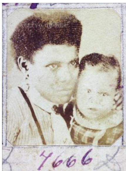
Imagens 18 e 19: s/ título, 1870-74 / 1876. Papel albuminado, monocromia. 2,6 x 2,8 cm / 2,5 x 3 cm. Coleção Militão Augusto de Azevedo, Museu Paulista – Universidade de São Paulo.