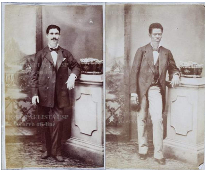
Imagens 5 e 6: s/ título, 1879. Papel albuminado, monocromia, 5,5 x 9 cm.

Retornemos, então, às imagens. Além de amas de leite como aquela retratada nas fotografias que abrem o texto, outras tantas mulheres, homens, crianças e famílias negras aparecem entre os retratos produzidos pelo fotógrafo nos anos de funcionamento de seu estúdio na cidade. Conforme têm observado autores como Sandra Koutsoukos e Íris Araújo, do ponto de vista formal as imagens em que estes sujeitos figuram não diferem substantivamente daquelas nas quais encontramos mulheres, homens, crianças e famílias brancas – certamente, a maior parcela do público atendido neste ateliê.