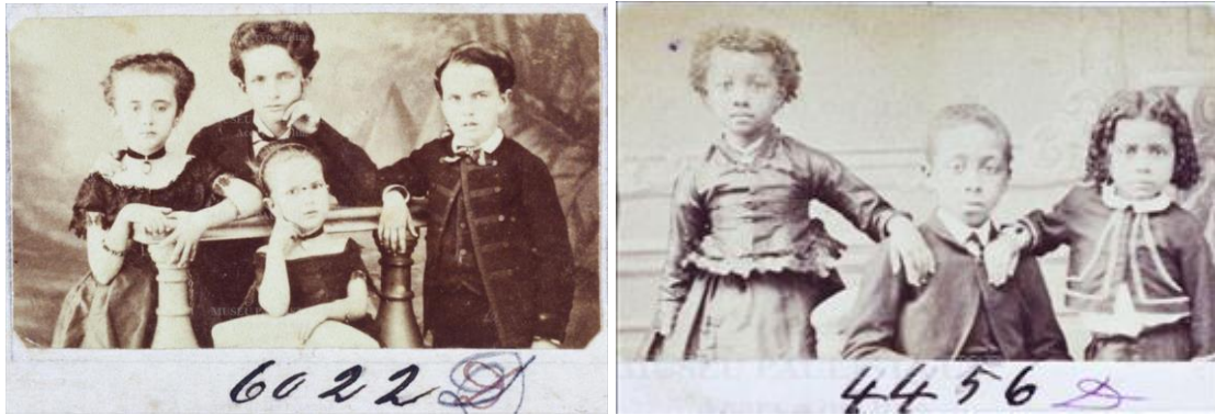
Imagens 14 e 15: s/ título, 1874 / 1873. Papel albuminado, monocromia, 5,1 x 3 cm.