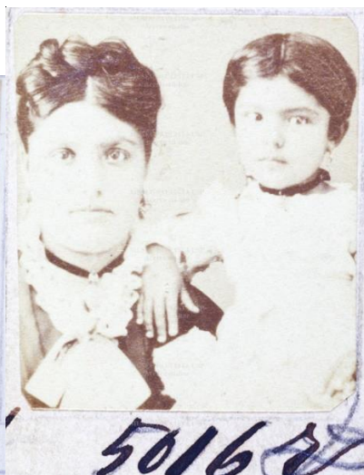
Imagens 16 e 17: s/ título, 1865-70 / 1874. Papel albuminado, monocromia. 2,5 x 3 cm / 2,5 x 2,9 cm.