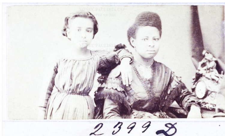
Imagem 1: s/ título, 1870-1874. Papel albuminado, monocromia, 5,5 x 2,9cm.

É pouco o que se sabe sobre essa fotografia. Foi feita entre 1870 e 1874, em São Paulo, por Militão Augusto de Azevedo, então empregado e gerente no estúdio Photographia Academica . 1 Revelada em papel albuminado, foi arquivada em formato diminuto no álbum construído pelo próprio fotógrafo, no qual mantinha registro de fotografias que pudessem, mais tarde, ter novas cópias solicitadas pela clientela. 2 No pequeno espaço da imagem, 5,5 x 2,9 cm recortados e colados nas páginas do álbum, a riqueza de detalhes se impõe. Uma menina branca, em pé, vestido riscado e acinturado, pousa diligentemente o braço e a mão esquerdos sobre o ombro de uma mulher negra. Sentada, repousando também seu braço sobre uma mesa lateral, vê-se a mulher esmeradamente adornada: vestido bonito com colo e mangas trabalhados, brincos e colar delicados, cabelos penteados, repartidos de lado. O cenário é pouco aparatado – a sombra de uma cortina, um relógio sobre a mesa, o espaldar da cadeira em que se senta a mulher discretamente exposto. Na cena montada com cuidado, ambas miram a câmera de soslaio; os olhares fixos, algo distantes, e os semblantes sérios trazem algum desconforto, perturbando a sugestão de intimidade dos corpos aproximados. É pouco o que se sabe sobre esta fotografia, mas é o suficiente para que saibamos tratar-se do retrato de uma ama de leite – possivelmente ama seca, dada a idade da