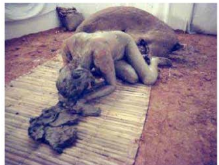
Figura 4 Celeida Tostes, Rito de passagem , 1979, performance fotografada por Henry Stahl Disponível em: http://bibliotecadigital.fgv.br/dspace/bitstream/handle/10438/2146/CP-DOC2006RaquelMartinsSilva.pdf?sequence=1&isAllowed=y