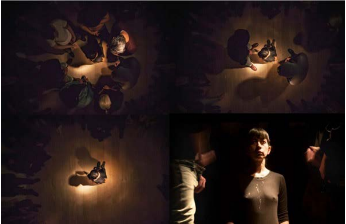
Figura 2 Regina José Galindo, La Manada , 2018, performance fotografada por José Luis Isquierdo Disponível em: https://www. reginajosegalindo.com/

Em uma sala da Galeria de Arte Black Balance, em Madrid, sete homens se masturbam ao redor da artista, cujo corpo imóvel eles usam como lugar para depositar seus fluidos. O desenrolar da performance remete fortemente a assédios sexuais que ocorrem quotidianamente, nos mais diversos ambientes, incluindo espaços públicos, e têm como alvo majoritário os corpos femininos.