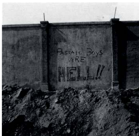
Imagem extraída da série de 24 fotografias em preto e branco de 7,6 x 7,6cm

Depois disso voltei a Passaic, ou será que isso era a posteridade – pois tudo o que sei é que aquele subúrbio sem imaginação poderia ter sido uma eternidade desajeitada; uma cópia barata de A cidade dos imortais . Mas quem sou eu para pensar essas coisas? Desci por um terreno de estacionamento que cobria os velhos trilhos da estrada de ferro, trilhos que algum dia cortaram Passaic. Esse monumental terreno de estacionamento dividia a cidade em duas, transformando-a em espelho e reflexo – mas o espelho ficava trocando de lugar com o reflexo. Não se sabia nunca de que lado do espelho se estava. Não havia nada de interessante ou mesmo estranho a respeito daquele monumento plano; contudo, ele ecoava um tipo de ideia-clichê da infinidade; talvez os ‘segredos do universo’ sejam prosaicos do mesmo modo – para não dizer enfadonhos. Tudo que dizia respeito àquele local permanecia emaranhado em afabilidade e coberto com carros brilhantes – um após outro, eles se estendiam em uma nebulosidade ensolarada. As indiferentes partes traseiras dos carros reluziam, refletindo o envelhecido sol da tarde. Tirei alguns retratos lânguidos, entrópicos, desse monumento resplandecente. Se o futuro é “ultrapassado” e “fora de moda”, então estive no futuro. Estive em um planeta que tinha, desenhado sobre ele, um mapa de Passaic, e um mapa bastante imperfeito. Um mapa sideral marcado com “linhas” do tamanho de ruas, e “quadrados”