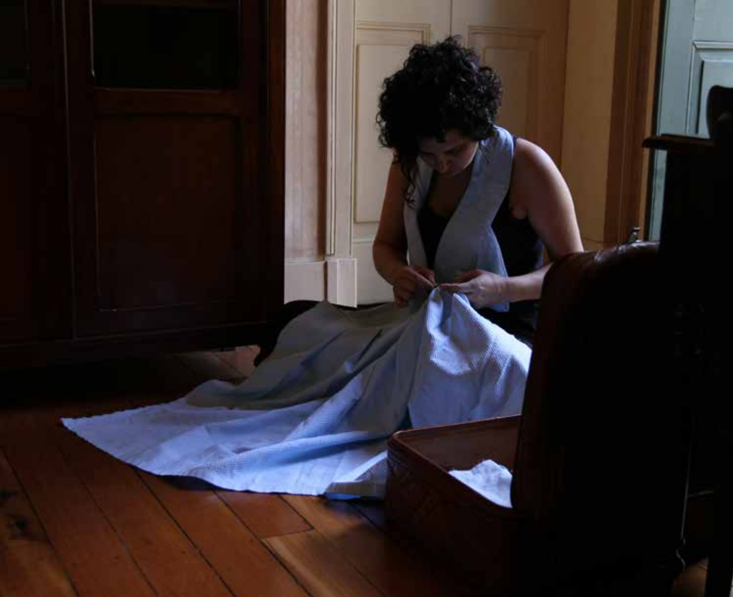
Desfazimento (2013), 70', performance, still de vídeo

vestígio do gesto. Indelével, o desenho arrebatava esse índice de um quase lugar.