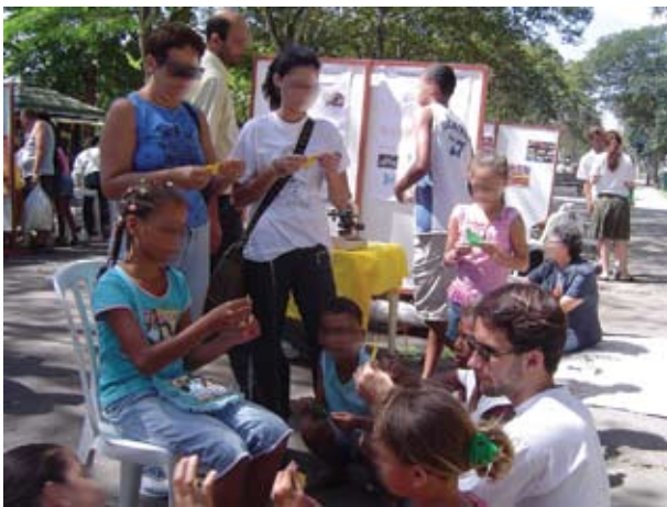
Figura 2 Oficina de Origami realizada durante o “Bio na Rua”, crianças fazendo origami do peixe.

Cabe ressaltar que as atividades de origami auxiliam no desenvolvimento motor e mental dos participantes, desenvolvem a parte lógica e artística do cérebro e auxiliam em um conhecimento inicial sobre paleontologia.