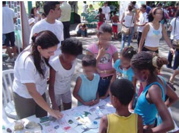
Figura 1 Aplicação do jogo durante o “Bio na Rua”, Quinta da Boa Vista, Rio de Janeiro.

Além destas instruções, podemos destacar que o jogador ao chegar à casa referente à origem do Homem, pode se observar em um espelho, fazendo-se perceber como parte deste processo e ao chegar no final, para ganhar o jogo, precisa comentar a seguinte questão: “O que o homem esta fazendo com esta história de bilhões de anos”. Essa última questão baseia-se em princípios autoreflexivos da Educação Ambiental, fazendo com que estes indivíduos se tornem mais críticos em relação ao meio ambiente em seu entorno.