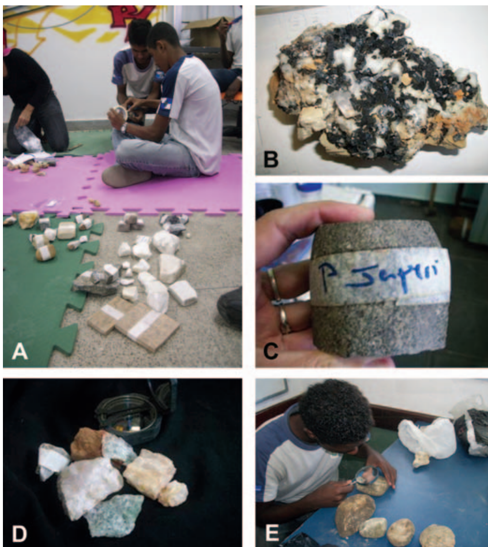
Figura 2 - Material coletado por estudantes do Ensino Médio, trazidos para discussão em sala de aula. (A) rochas coletadas por alunos de Santa Cruz, CIEP 392; (B) amostra com intercrescimento de quartzo, turmalina e microclina da região de Itaguaí, coletada por aluno do CIEP 368; (C) exemplar de diabásio coletado por alunos de Paracambi, CIEP 500; (D) exemplares coletados por alunos do Colégio Estadual Presidente Dutra, Seropédica, (E) estudante do Colégio Estadual José Maria de Brito, Itaguaí, analisa amostras de seu grupo de pesquisa.

Além do curso em moldes tradicionais, cada escola desenvolve um projeto individual que consiste no levantamento das características geológicas locais na construção de um acervo composto por informações (dados coletados e relato de situações, traduzidos na forma de textos, gráficos e imagens) e materiais (mapas, fotos, amostras de rochas e minerais). A composição dos grupos de trabalho fica a critério das próprias escolas e o andamento de cada projeto é acompanhado por visitas periódicas às unidades, por parte de um docente da UFRuralRJ. Nestas visitas, o material coletado pelos estudantes é classificado e discutido em termos de seu significado, sua origem, alteração, uso industrial e demais características que se apliquem aos exemplares obtidos pelos diversos grupos (Figura 2).