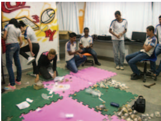
Figura 3 Amostras coletadas por estudantes do CIEP 392.

satélite da região, feições geológicas e geográficas que lhe são familiares. A cada visita, novos dados e materiais são acrescentados ao acervo, que se torna representativo do patrimônio geológico local (Figuras 3, 4 e 5).