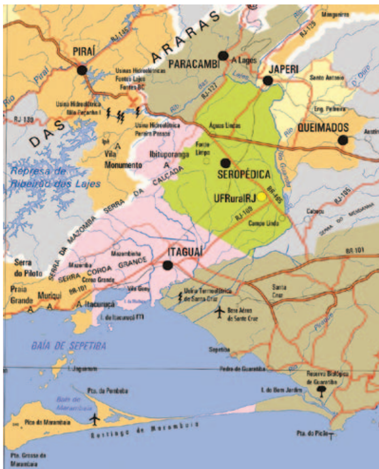
Figura 1 Localização das unidades escolares participantes do projeto “O Ciclo das Rochas em Terras Fluminenses” em 2010. Base cartográfica: Departamento de Estradas e Rodagem (2006)

O projeto envolveu nove escolas vinculadas a Secretaria de Estado de Educação, em quatro municípios (Figura 1), situados no entorno do campus universitário da Universidade Federal Rural do Rio de Janeiro (UFRuralRJ). A participação no