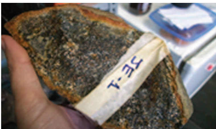
Figura 5 Rocha coletada por estudantes e respectivas seções delgadas sob microscópio petrográfico.