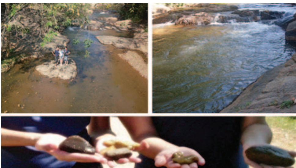
Figura 4 Estudantes de Paracambi observam processos de sedimentação em rio que corre sobre leito gnáissico. Fotos obtidas por alunos do CIEP 500.