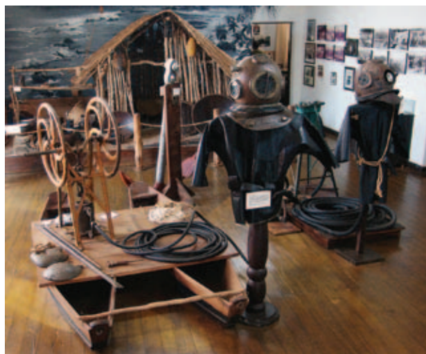
Figura 5 Imagem da sala principal do Museu Histórico Desembargador Edmundo Mercer, em Tibagi, mostrando o acervo ligado à mineração do diamante no início do século XX.

O Museu Histórico Desembargador Edmundo Mercer, também chamado Museu do Garimpo, é conhecido como um dos mais importantes acervos do Paraná (Figura 5). Criado em 1985 com a proposta de manutenção cultural da história do município, destacou-se pelo conteúdo ligado ao garimpo, sendo sua principal sala de exposições o único local da região Sul do Brasil a apresentar os objetos, imagens e textos sobre o tema da mineração. Dos museus diretamente ligados à história do diamante no Brasil, o museu de Tibagi figura entre os mais completos e bem documentados, além de constituir atualmente um atrativo turístico obrigatório do município. Uma das salas do museu também é dedicada à participação dos negros na formação da identidade cultural do município.