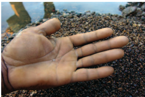
Figura 3 Exemplar de diamante com 0,45ct recuperado do rio Tibagi por garimpeiro baiano em 2006.

De qualquer forma, os depósitos de diamante na bacia do rio Tibagi não apresentam um controle geológico definido, apenas alguns poucos pontos de concentração em meio colúvio-aluvionar espalhados por um território de grande superfície. Este caráter errático de distribuição do mineral precioso provocou um tipo de garimpagem disperso e, até certo ponto, de baixo impacto econômico na região. Estudos estatísticos em lotes mostraram que os diamantes de Tibagi (Figura 3) são de muito boa qualidade, mas de tamanho predominantemente pequeno, em torno de 0,20ct (Chieregati, 1989; Liccardo & Mesquita, 2010). Tradicionalmente a busca de diamantes em Tibagi sempre esteve associada a outras práticas de economia, como a agricultura e a pecuária, o que tornou esta região diferente de outras onde a mineração representou fortes ciclos econômicos com grande impacto social.