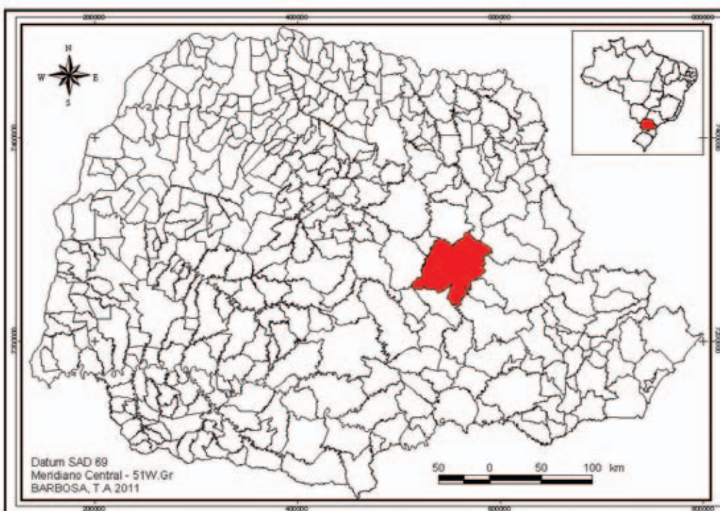
Figura 1 Localização da área de estudo, município de Tibagi no estado do Paraná.

O primeiro registro escrito sobre a presença do diamante nesta região é de 1754, quando Anselmo, um escravo de Ângelo, faiscando os córregos se