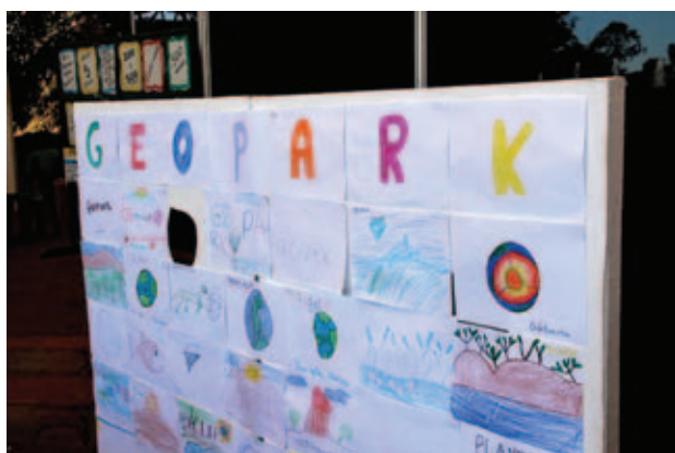
Figura 9 Desenhos produzidos pelas crianças com os temas das oficinas.