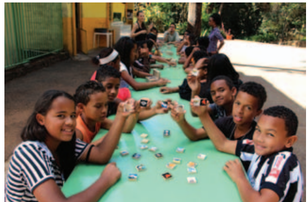
Figura 8 Brincadeiras com o jogo da memória.