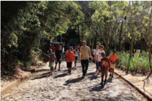
Figura 5 Crianças percorrendo trilha de roteiro guiado por educador ambiental.

As oficinas eram iniciadas com as crianças participantes percorrendo as trilhas dos roteiros guiados por educadores ambientais com paradas para explicação nos pontos de interesse geológico (Figura 5). Ao final, de volta à Praça das Águas de onde partiram, as crianças eram orientadas a sentar em roda para ouvir as histórias do livro “Contos da Dona Terra” (Figura 6). De forma participativa e envolvente os contos eram lidos por contadores de história e educadores ambientais. Após a leitura as crianças participaram em grupos da montagem de quebra-cabeças e brincaram de jogo da memória (Figuras 7 e 8).