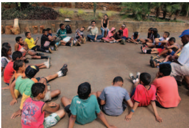
Figura 6 Roda para ouvir os Contos da Dona Terra.