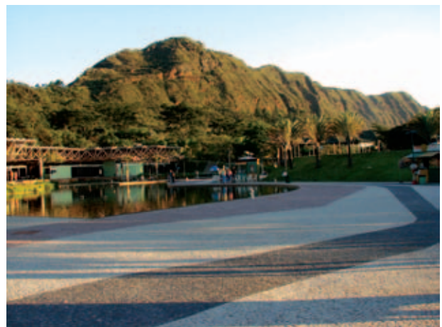
Figura 3 Vista da Praça das Águas com a Serra do Curral ao fundo- Parque das Mangabeiras, Belo Horizonte

A implementação do Projeto foi iniciada no Parque das Mangabeiras - Serra do Curral (Figura 3). Foram realizados trabalhos de campo para identificação de afloramentos considerados chave para o entendimento da evolução geológica do sítio em questão e de outros aspectos importantes