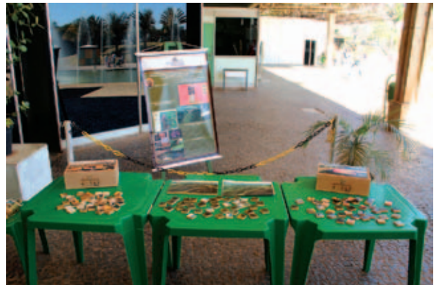
Figura 7 Kits de quebra-cabeças dos sítios geológicos do Quadrilátero Ferrífero.