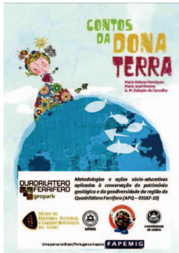
Figura 4 Capa do livro Contos da Dona Terra com o selo do Projeto.

- Quebra-cabeças composto por 40 peças em madeira cobertas por material PVC autocolante. Os quebra-cabeças têm como temas os sítios geológicos do Quadrilátero Ferrífero: Serra do Rola Moça, Serra do Curral e Pico do Itacolomi. No caso específico da Serra Curral buscou-se valorizar na montagem a vista geral da Serra a partir do Parque e também afloramentos de rochas que se destacam na paisagem.