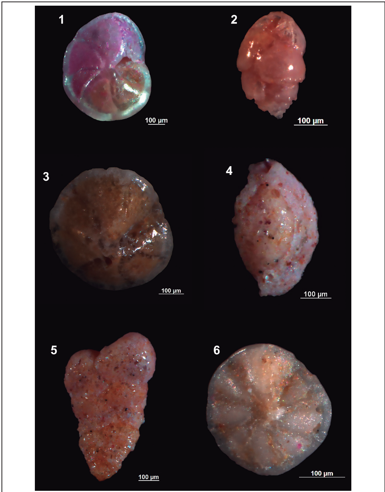
Figura 3 Espécies dominantes e principais: Poroepionides lateralis (1), Bulimina marginata (2), Eponides repandus (3), Quinqueloculina agglutinans (4), Textularia agglutinans (5) e Buccella peruviana (6). Fotomicrografias através do microscópio Zeiss, mod. Discovery V12 acoplado a câmara Axioplan e sistema de imagens Axiovision.