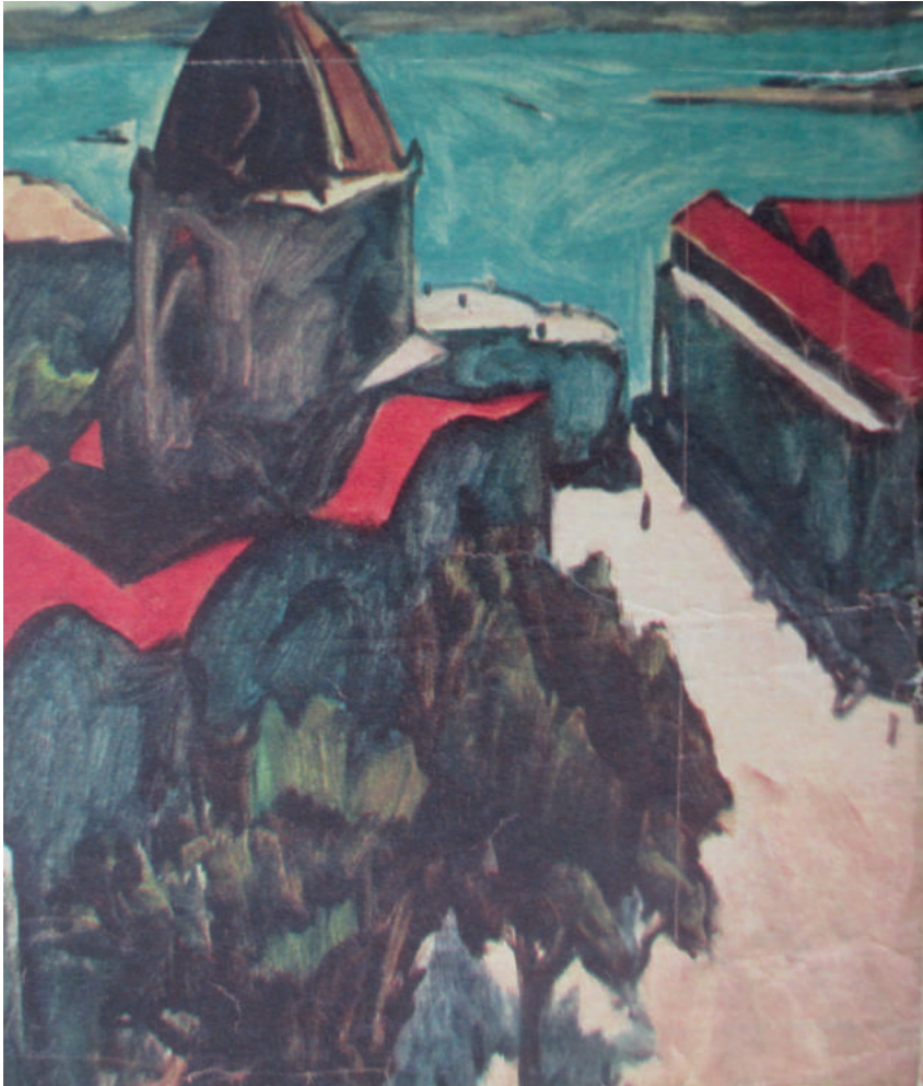
Figura 1. Serguei Urussévski, Os telhados vermelhos . Crédito: Arquivos do ICAIC (Instituto Cubano del Arte e Industria Cinematográficos).

mesmo tempo, sem querer exotizar a paisagem? Em vez de tentar mostrar a infinidade de seus detalhes, o diretor de fotografia também prefere unir essa abundância numa “tropicalidade floral”, envolvendo toda a vegetação com uma brilhante cobertura de açúcar. Ou talvez, essa mesma sensação de ausência, produzida por um filme em preto e branco num lugar de explosão de cores, instigasse a Urussévski a poetizar a paisagem. Por isso também o chamam de poeta cinematográfico. Mikhail Kalatozov, o diretor de Soy Cuba também dizia que o tipo de cinema que fazia era o cinema do imaginário poético. Além disso, o propósito do filme para os criadores russos era “[d]ifundir, através da cinematografia mundial, toda a poesia e transcendência histórica da Revolução Cubana [como a] [...] melhor resposta às agressões do