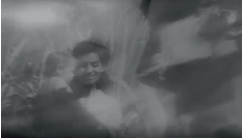
Figura 2. Fotograma de Soy Cuba . A câmera com a água no objetivo.

Mas também a maneira de filmar a cena pode ter a ver com a primeira experiência da chuva tropical que descreve Maiakóvski: