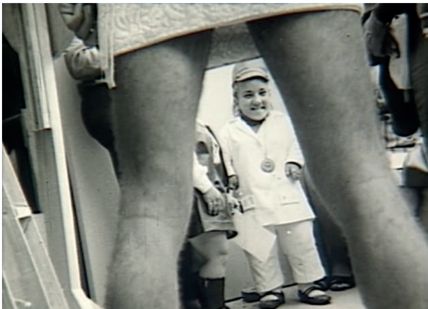
Figura 13. Fotografia de Hitler, Terceiro Mundo . A câmera passando entre as pernas do homem da bandeira americana mostra as duas anãs. Crédito: Fredson Clayton, “Filme - Hitler 3º Mundo (1968)”. < http://www.youtube.com/watch?v=Re8D0LD7U-0&t=1s >