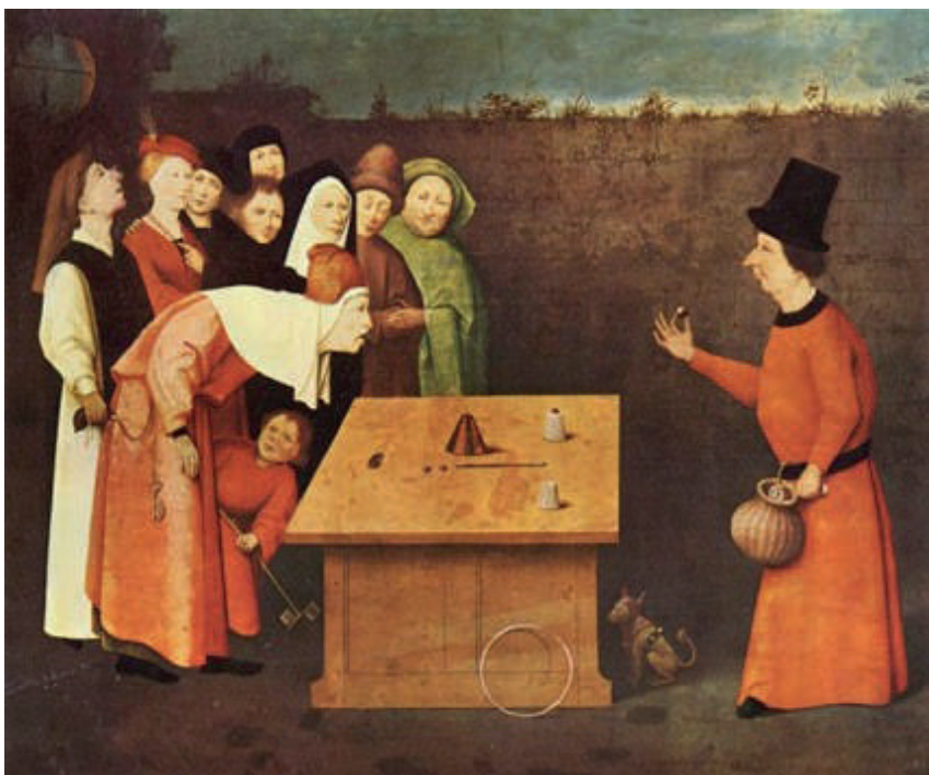
Figura 9. Hieronymus Bosch, O Prestigiador .