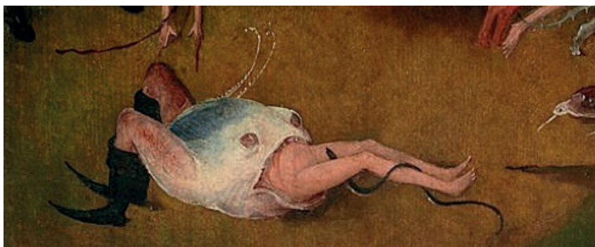
Figura 11. Hieronymus Bosch, fragmento de O Carro de Feno .

Embora pareçam sem o menor sentido, algumas imagens das pinturas de Bosch são uma representação visual das expressões comuns que usava o povo naquela época. Segundo Beagle, “Bosch constantemente lança mão do material folclórico também, recorrendo aos provérbios, aforismos e superstições; dramatizando qualquer tipo de slogan , quer como elemento central, ou só um comentário à parte, quase subliminal na sua mundanidade” (BEAGLE, 1982: 33). Para ilustrar, na Holanda a frase “o mundo está patinando sobre o gelo” usava-se para dizer que “o mundo se desliza e derrapa descontroladamente em direção à maldade” (BEAGLE, 1982: 88). Em geral toda a pintura de Bosch se converte em uma escritura com imagens: “No inferno de Bosch, tudo é uma gíria visual, uma representação física das crenças populares” (BEAGLE, 1982: 51). Assim, colocando a fala do povo nos trípticos, o pintor trouxe a língua falada ao lugar reservado para a solenidade. Do mesmo jeito, fazem Agrippino e Jabor ao trazerem a trivialidade da vida quotidiana à tela e à literatura. Não é em vão que Agrippino, às vezes, é chamado de “James Joyce brasileiro”. Assim, no romance, a destruição do sentido semântico parece ter o mesmo propósito que têm os quadros de Bosch.