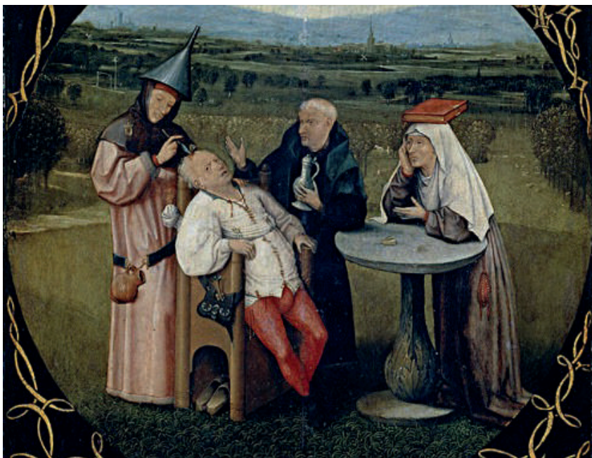
Figura 7. Hieronymus Bosch, Extracção da Pedra da Loucura .

Embora neste quadro o “cirurgião” não bata o prego na orelha, um