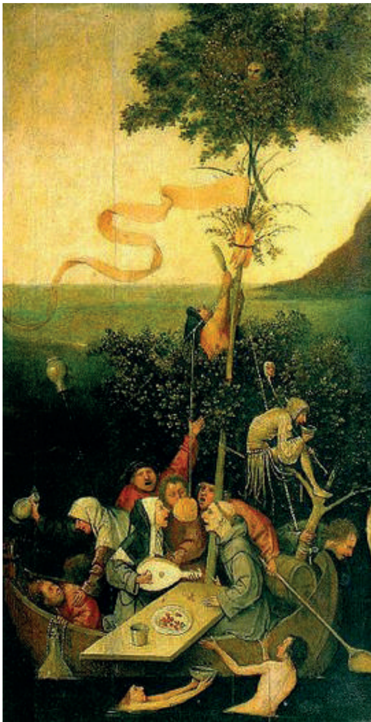
Figura 10. Hieronymus Bosch, Navio dos Loucos .