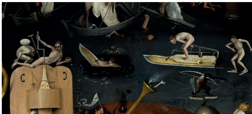
Figura 6. Hieronymus Bosch, fragmento de Jardim das Delícias Terrenas .

A parte que parece beirar a loucura no Lugar Público , na verdade, é uma écfrase dos quadros do pintor holandês Hieronymus Bosch. Por exemplo, o narrador diz: “Atravessei a ponte sobre o rio e avancei em direção à margem. O inverno era intenso e fui obrigado a colocar os patins para deslizar sobre a superfície lisa de gelo” (PAULA, 2004: 149). A descrição se parece com o detalhe do rio no quadro O Jardim das Delícias Terrenas , de Bosch (Fig. 6), em que as pessoas e outras criaturas têm que vestir os patins para atravessar o rio, mesmo que seja a única coisa que vestem. Ou, por exemplo, a seguinte conversa parece descrever o quadro Extração da