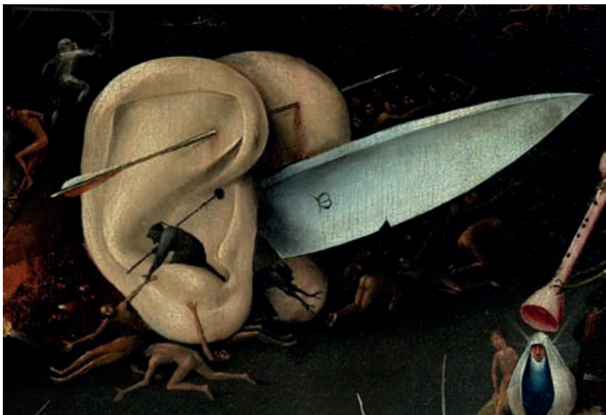
Figura 8. Hieronymus Bosch, fragmento de Jardim das Delícias Terrenas