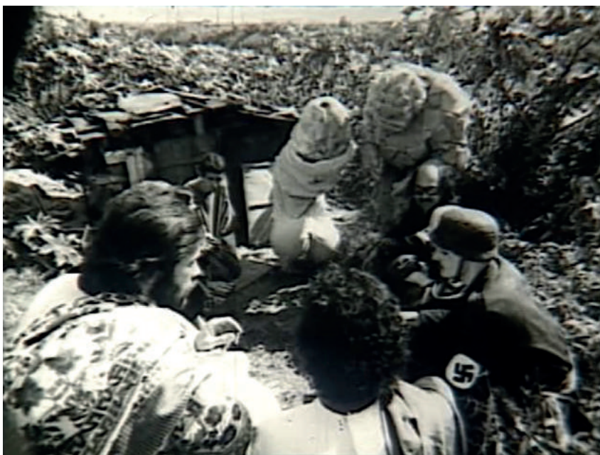
Figura 5. Fotograma de Hitler, Terceiro Mundo . Jesus Cristo, Pedro, os fascistas, uma espécie de Hulk tropical e um enorme pênis numa reunião.