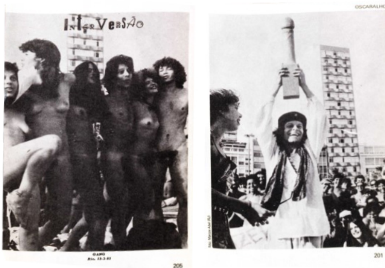
Figura 3 – Grupo GANG del Movimiento Arte Pornô. Performance INTERVERSÃO en la playa de Ipanema, Río de Janeiro, 13 de febrero de 1982. (Fuente: KAC; ASSIS TRINDADE, 1984, p. 205 y 201).

Este exhibicionismo pone en tensión múltiples capas temporales. Por un lado, disputa a un orden neoliberal en formación, una gestión del placer y del goce. Por otro, profana un dispositivo colonial y practica una herencia de la desnudez a contrapelo, ya que, como señalan Mario Cámara y Gonzalo Aguilar (2019, p. 26), los integrantes de Arte Pornô, como los indios que enfrentan a los primeros colonizadores portugueses, no tienen vergüenza de estar desnudos. En sus performances, la exhibición del cuerpo desnudo no provoca culpa y pudor sino goce y alegría, despliega una festividad que construye un modo de mirar y de ser mirados que desconoce la vergüenza, la herencia colonial. Desestabiliza, entonces, la subjetividad hegemónica del hombre blanco, occidental, humanista, racional (y vestido), a la vez que disputa la gestión del placer y el goce y la captura del cuerpo desnudo como mercancía. Reinventa, finalmente, el vínculo entre arte, política y militancia respecto a tradiciones de izquierda, conjugando, no sin irreverencia, marxismo y sexualidad, como se lee en el poema “Análisis Ma(r)xista” de Braulio Tavares: “a luta do capital / para dominar o trabalho / é como o drama de um pau / que quer foder um caralho” (KAC; ASSIS TRINDADE, 1984, p. 40).