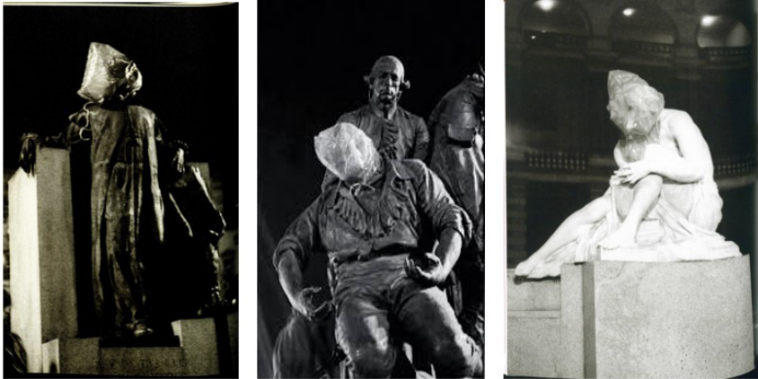
Figura 1 – Operação ensacamento , 3Nós3, 1979.

Mientras que en el cuento de Noll el pasado no se nombra (el padre está mudo) pero se hace visible en su cuerpo mutilado, en Ensacamento , se escribe sobre estos cuerpos de piedra que devienen no solo un escenario de la obra sino su material mismo. Un material que, mediante una operación de borrado, se exhibe. La acción de 3Nós3 incorpora esa estatuaría al presente, asume el desafío de volver maleable el mármol, de hacer que a través de los héroes “patrios” memorializados en piedra hablen aquellos cuerpos desaparecidos que ni siquiera podrán tener duelo y sepultura.