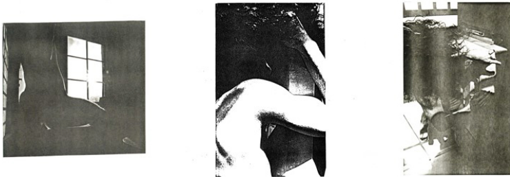
Figura 5 – Fotografías fotocopiadas, Xerox Action .

con una fotocopidora, y tres imágenes “tomadas” por la misma máquina que mostraban, en detalle, diferentes partes del cuerpo del artista (Figura 6). La borrosidad es, en toda la serie, una estrategia sustancial de exhibición.