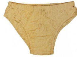
SEM FETIDA, ANOS 1980 ACRILICO SOBRE TECIDO ENCORADO 20 x 10 x 0,5 CM