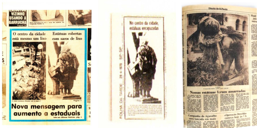
Figura 2 – Notícias que informan sobre “estatuas encapuzadas”.

ciudad (el de la patria, la nación, los vencedores) exhibiendo la piedra de sus estatuas como un organismo vivo y dinámico, abierto, inserto en la disputa por la reinscripción de cuerpos y la reinención de modos de vivir, en una construcción continua que ocurre en el diálogo entre el cuerpo propio y el cuerpo de otro, entre lo singular y lo colectivo. En ese uso lo público no solo se ocupa sino que, además, se reinventa 9 .