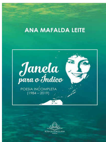
(Editora Rosa de Porcelana, Lisboa, 2020)

As escolhas gráficas que promovem o jogo metapoético da capa do livro configuram convite à parte ao leitor, que pode fazer diversas conjecturas sobre ser uma obra poética (auto)biográfica a que tem em mãos: associando essa capa à contracapa e aos poemas – em letras e imagem. Isso se justifica porque, conforme assinala Jacyntho Lins Brandão, o próprio Barthes, em 1968, declarara a “morte do autor”, e argumentou, nos anos 1970, “que é preciso considerar um ‘autor de papel’, isto é, a presença do escritor na obra por meio de ‘alguns pormenores’, ‘alguns gostos’ ‘algumas inflexões’, o que ele batizou de biografemas” (BRANDAO in LEÃO, 2016, [orelha do livro]).