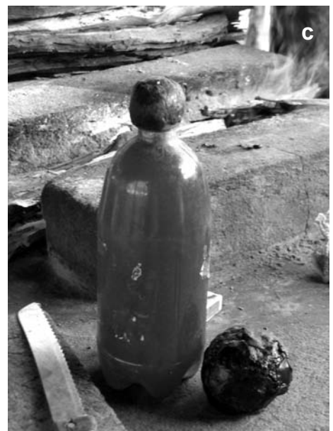
Fig.5- Uso da cera de abelha pelos Pankararé para conservação de produtos agrícolas: (a) Silos. Altura 1m; (b) Latas e botijões plásticos; (c) Garrafa plástica. Volume 1l e de vidro.