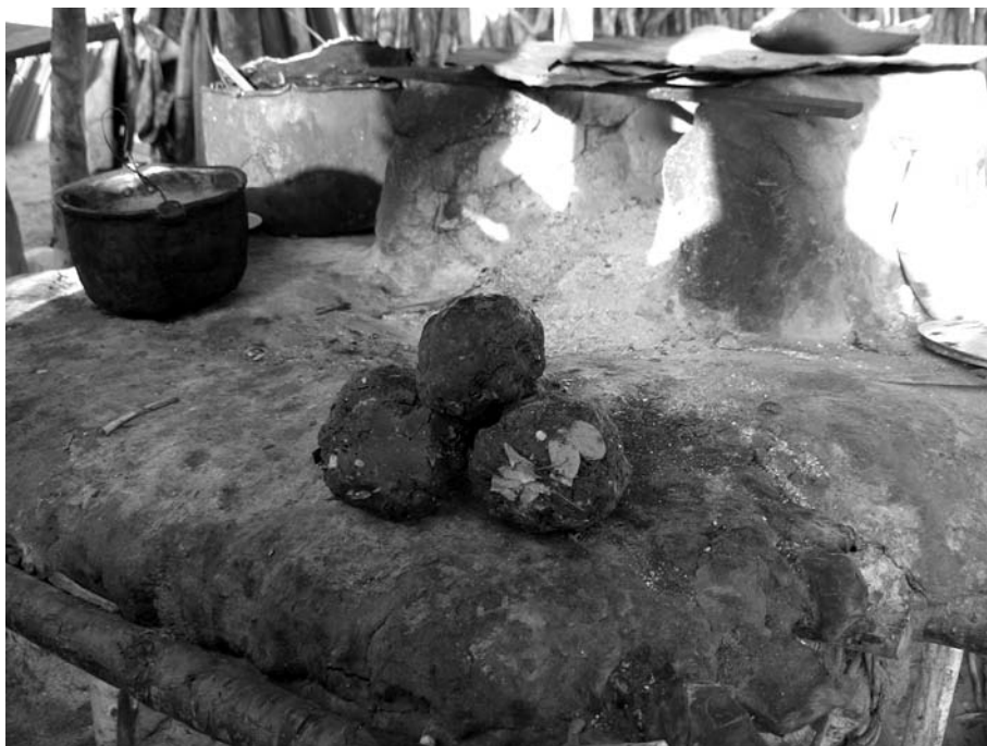
Fig.2- Bolotas de cera de Frieseomelitta doederleini (“abeia branca”). Diâmetro ca 10cm.