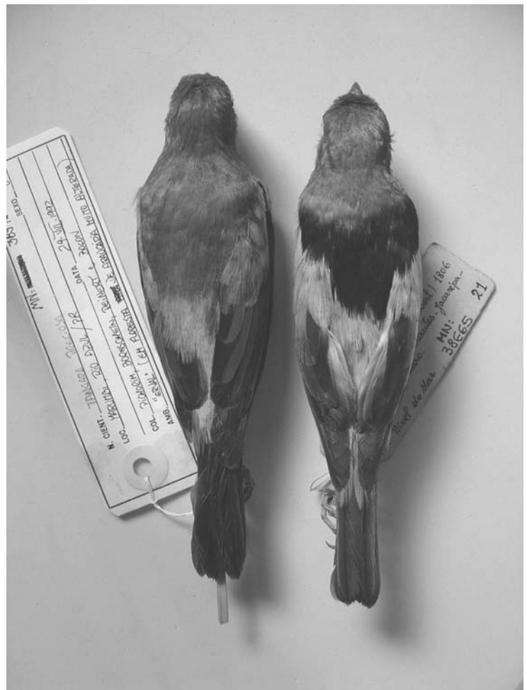
Fig.1- Padrão de coloração do manto dos machos de Tangara preciosa (esquerda, MNRJ 38541) e T. peruviana (direita, MNRJ 38665)

No caso das fêmeas, a coloração do ventre tende ao verde amarelado (cor 57) em T. peruviana e ao verde acinzentado (cor 47) em T. preciosa , apesar da plotagem no mapa (Fig.3) demonstrar a grande variação individual desse caráter em ambas espécies. Essas apresentam indivíduos com os dois padrões de colorido no Estados de São Paulo e Paraná, inviabilizando a diagnose entre as fêmeas das espécies.