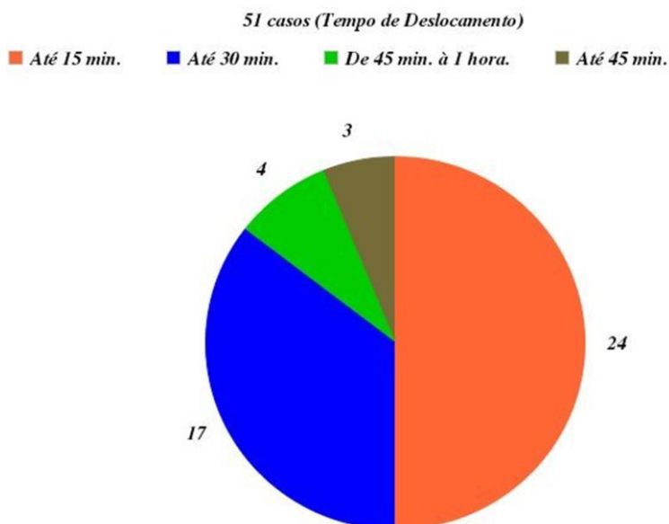
Figura 2: Gráfico sobre o tempo de deslocamento dos alunos até as escolas.

Nos gráficos, vemos que é maior o número de alunos que fazem deslocamento a pé da residência até a instituição de ensino, assim como é maior a quantidade de pais que optaram por escolas que a distância é de até 15 minutos com a residência.