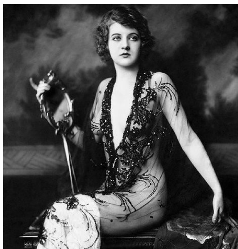
FIGURA 1 – Flapper.