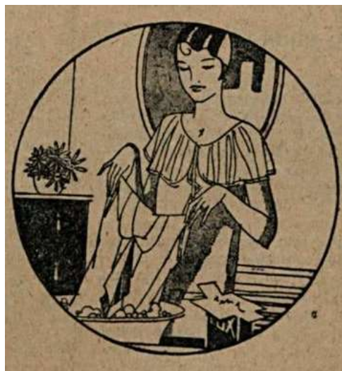
FIGURA 3 – Propaganda do Sabão LUX. Revista Fon Fon, Rio de Janeiro, a. 24, n. 22, 31 de maio de 1930, p. 9.

“O Lux revolucionou os antigos métodos de lavagem. A mulher moderna não corre mais o risco de estragar as suas roupas finas esfregando-lhes com um sabão ordinário; prefere laval-as com essas macias escamas que limpam com tanta rapidez e segurança os tecidos mais diaphanos” 39 .