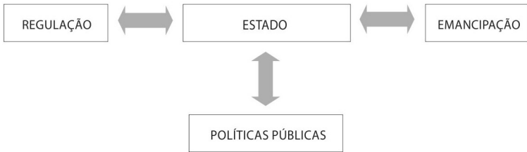
Diagrama 2. Proposta para a avaliação de políticas públicas (ii). Elaboração própria.

Em outras palavras, avaliar sob uma perspectiva antropológica, ao mesmo tempo em que implica, metodologicamente, um esforço orientado para a compreensão e construção das trajetórias das políticas, impõe que se leve em conta a compreensão da ação do Estado e a busca do entendimento das mudanças advindas das políticas a partir de diferentes agendas, interesses e pontos de vista. Sua descrição deverá enfrentar a compreensão das dinâmicas da política, relacionando-as à agenda do Estado e circunscrevendo relações de poder consubstanciadas, dialeticamente, nas disputas políticas dos diferentes atores, entre perspectivas políticas regulatórias e/ou emancipatórias (SANTOS E AVRITZER, 2003).