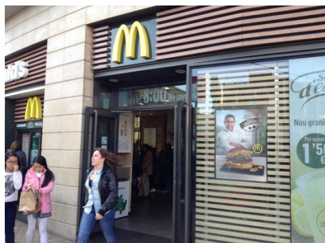
Imagem 3. McDonalds do 'centro', Collblanc Road