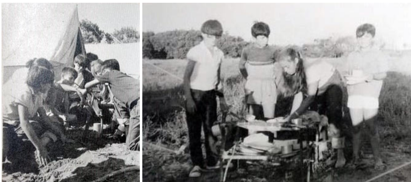
Imagen 1 y 2. Niños en sus carpas y construyendo un posa platos para la cocina del campamento (c. 1967).