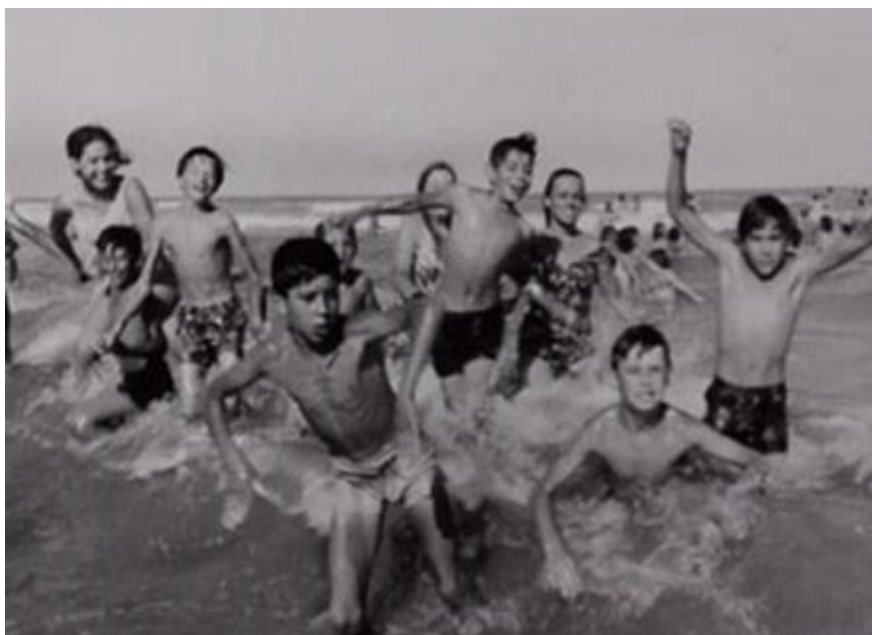
Imagen 3. Niños bañándose en el mar, campamento a Miramar (1967)