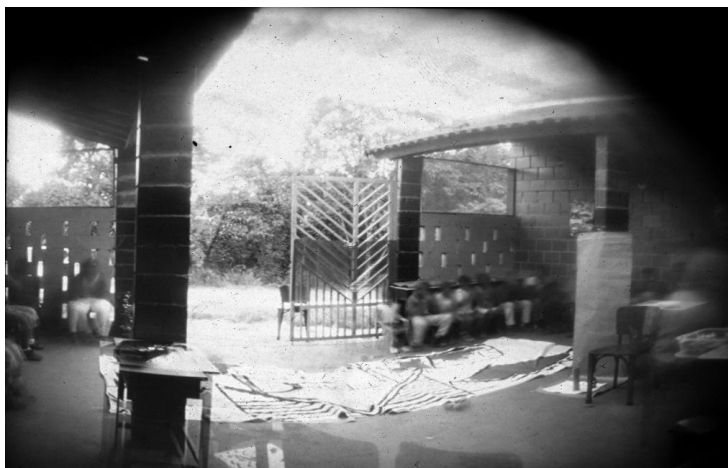
Foto coletiva do portão de entrada da Ciranda Infantil.

Ao andar com as crianças pelo assentamento, percebem-se as casas, hortas e animais, ao mesmo tempo em que é revelada uma arquitetura imaginária, onde anseios por futuras construções são esboçados em suas falas. O espaçamento entre moradias dá a impressão de um conjunto de vizinhos distantes, ledão engano. A distância espacial não separa os grupos. Enquanto as crianças construía suas câmeras e conversavam conosco, percebeu-se um conhecimento profundo das famílias e seus modos de vida no Dom Tomás, pois os gostos por animais e jeitos de morar eram destacados, assim como o jogo de bola no campinho recém-inaugurado e tão pleno de representações nas falas e práticas de todos, evidenciando múltiplas experiências cotidianas nesse espaço.