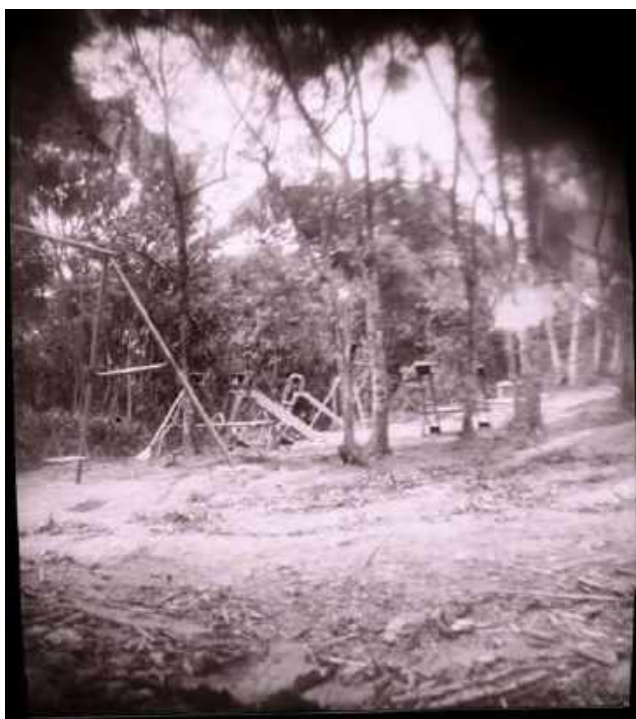
Imagem produzida coletivamente na oficina pinhole (acervo das autoras)

Recuperamos aqui a pergunta: quem fotografa quem e o quê? Que narrativas são elaboradas sobre o assentamento? Pelas crianças, o resultado de uma luta incessante se faz ver pelos brinquedos, e a dimensão brincalhona se faz corrente em reivindicações nem tão comuns, mas que insistem em nos afirmar que as crianças estão por lá, como moradoras e lutadoras, que revolvem a terra e a seus desejos e lhe configura outro ambiente.