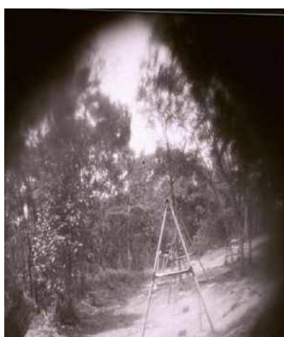
Imagens produzidas coletivamente na oficina pinhole