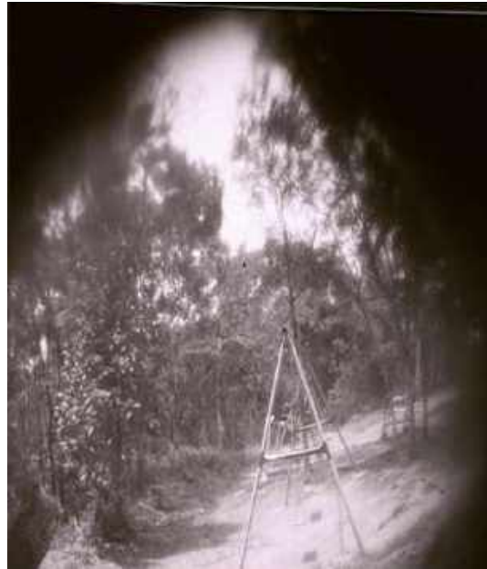
Fotografias produzidas por um grupo de crianças (acervo das autoras)

“O povo é o inventalínguas na malícia da maestria no matreiro.” (Haroldo de Campos)