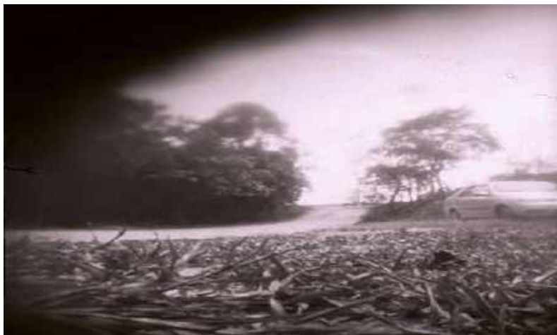
Fotografia produzida por um grupo de crianças (acervo das autoras)

Soando como um shamisen E feito apenas com um arame tenso um cabo e uma lata velha num fim de festa feira no pino do sol a pino Mas para outros não existia aquela música não podia porque não podia popular Aquela música se não canta não é popular Se não afina não tintina não tarantina (Haroldo de Campos)