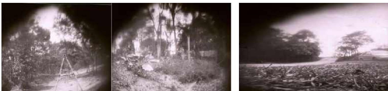
Fotografias produzidas por um grupo de crianças (acervo das autoras)

Não há aqui qualquer pretensão de esgotarmos o tema infância no campo, ou mesmo, de apresentarmos um texto que reúna somente as vozes e os pontos de vista das crianças. Embora importantes, de acordo com nossa estada em campo, as falas e a captação artesanal de imagens foram se entrecruzando e tecendo falas coletivamente. Assim, procuramos trazer, ainda que de modo muito breve, um pequeno pedaço da Comuna da Terra Dom Tomás Balduino, ora indiretamente por nossa narrativa de adultas pesquisadoras, ora pelas falas das crianças e fotografias por elas elaboradas.