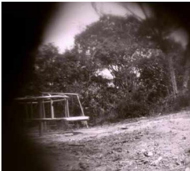
Imagem produzida coletivamente na oficina pinhole

As crianças saíam do local improvisado para revelar fotos segurando a fotografia como a um tesouro e mostravam-nas aos outros, discutindo sobre tudo o que foi feito. Processo de criação fecundo e, não poderíamos deixar de comentar, era possível perceber a alteração no repertório do olhar que interpreta o mundo via imagem fotográfica. Destacam-se as escolhas feitas que, segundo observamos, visavam a captar o brinquedo ou um recorte da paisagem como assunto da imagem.