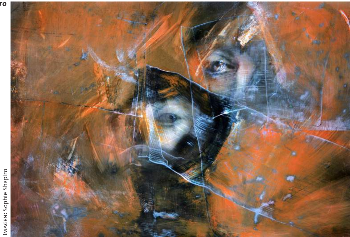
IMAGEN: Sophie Shapiro