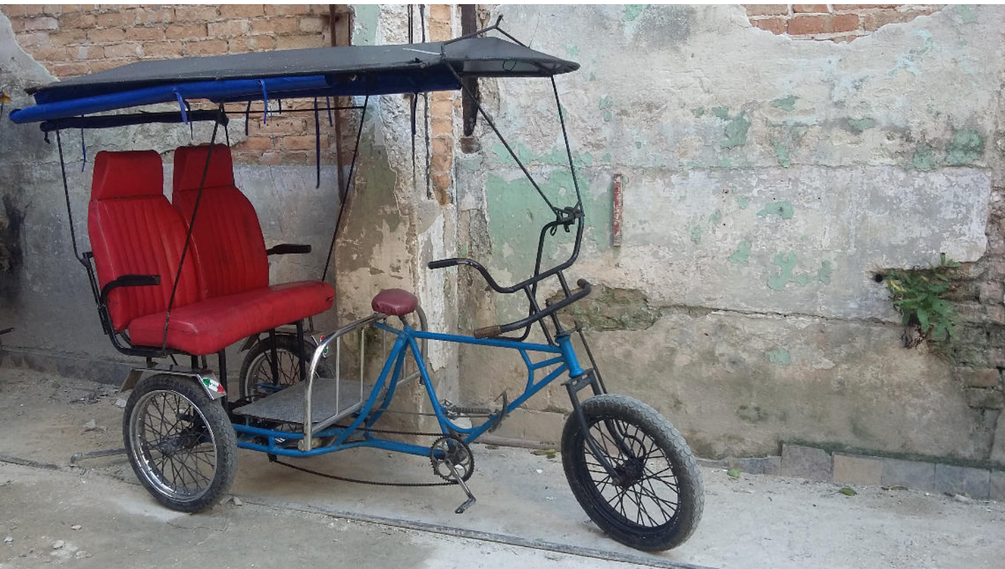
IMAGEN: Karima Oliva Bello