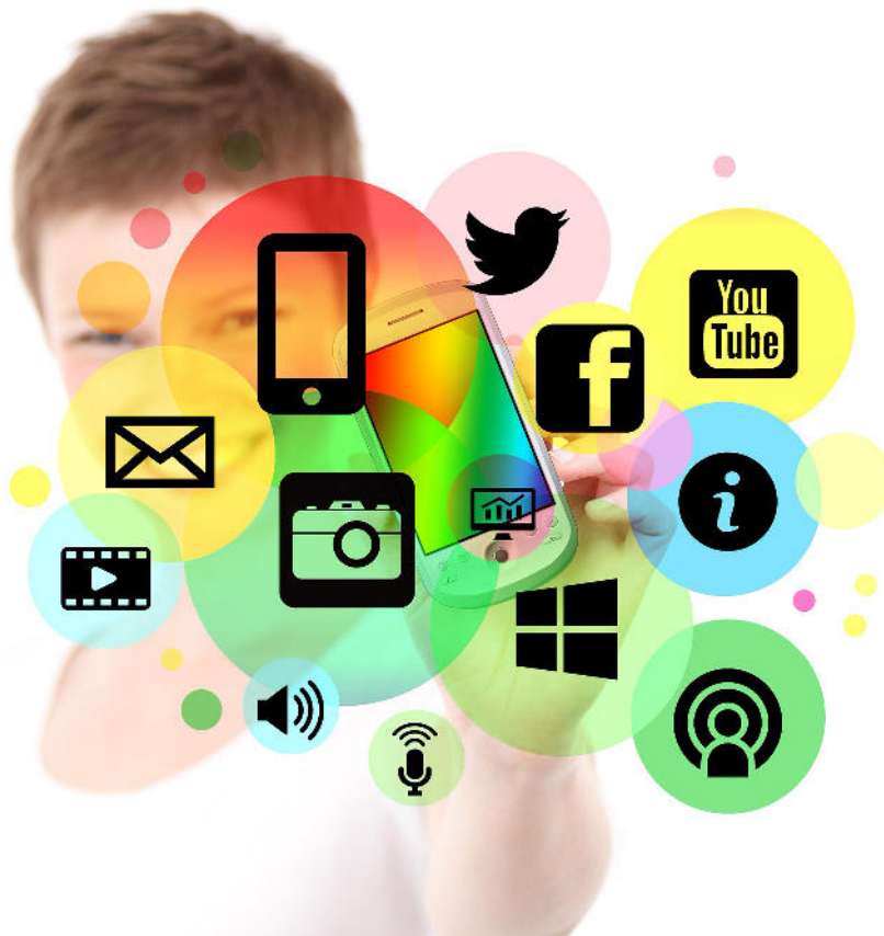
IMAGEN: Gerd Altmann