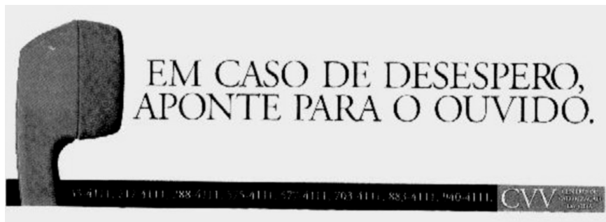
Figura 2: Ocorrência do verbo apontar sem a presença do complemento

Analisemos agora o verbo apontar , tal como aparece no anúncio expresso na figura (2).