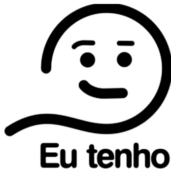
Figura 3: Ocorrência do verbo ter sem a presença do complemento

O slogan da figura (3) faz parte de um vídeo produzido pela associação Brasileira de Psiquiatria e visa enfatizar a idéia de que os transtornos mentais são doenças comuns, que podem atingir qualquer pessoa, e que, por isso, são tratáveis, e devem receber atenção como todas as outras doenças. O vídeo, que tem a duração de 30 segundos, apresenta profissionais de diversas áreas dizendo: “Eu tenho”. Nele, um locutor explica a alta incidência dos transtornos mentais e a importância de se procurar atendimento. A campanha termina com um enunciado resumidor: