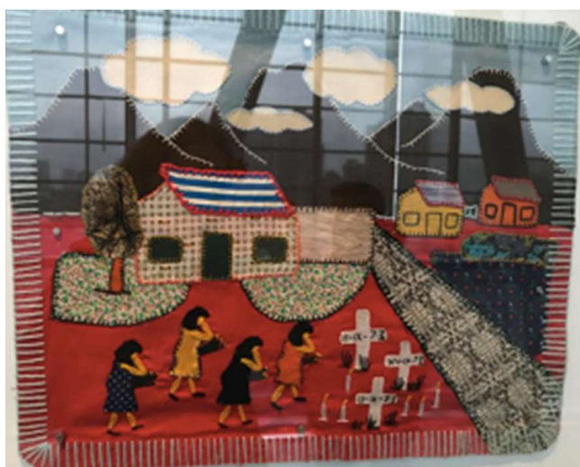
Figura 2 – Arpillera n° 08 Romería. Pilgrimage. 34,7 x 43 x 0,8 cm.