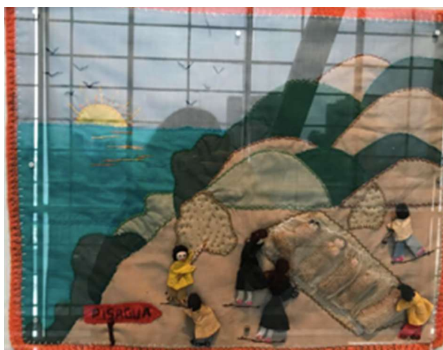
Figura 1 – Arpillera n° 06 Hellazgo en Pisagua. Find in Pisagua. 40 x 50 x 1,8 cm.

No conto “A mi me tocó la bandera”, a tessitura resgata a arpillera – movimento artístico e político fulcral no Chile no final do século XX. Essa técnica, surgida no litoral do país, consiste na composição de desenhos e reivindicações políticas em retalhos de tecido, costurados com relevos e pequenas bonecas que representam as autoras da obra. A técnica surgiu durante a ditadura militar de Pinochet e tinha como objetivo denunciar os abusos do sistema autoritário, sobretudo no que tangia aos desaparecidos políticos. Os trabalhos (Figura 1 e 2) configuraram-se como um espaço de resistência importante, transformando o papel da costura naquele período, ao registrar a memória, o testemunho e a luta política.