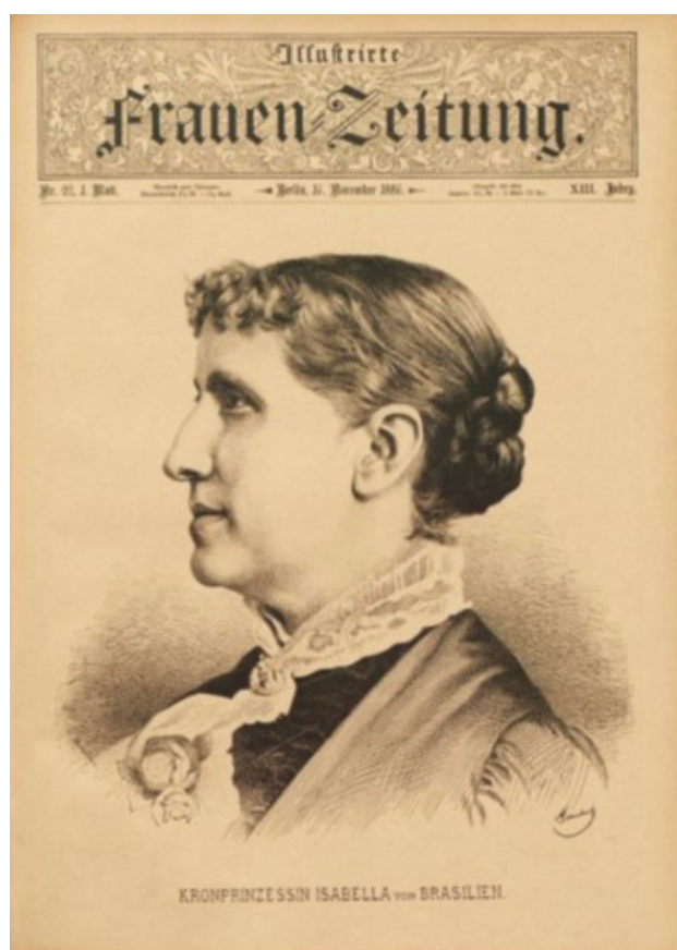
Figura 4. Princesa Isabel do Brasil na Illustrierte Frauen-Zeitung (16/11/1886).

O caderno de entretenimento da Frauen-Zeitung veiculava ilustrações, narrativas seriadas e artigos sobre assuntos como literatura, moda, decoração e economia doméstica. A capa do suplemento sempre trazia a gravura de alguma personalidade, como integrantes da nobreza ou escritores, e, nas páginas do caderno, havia um texto explicativo sobre a pessoa em questão. Na edição do dia 16 de novembro de 1886, por exemplo, encontramos uma imagem da Princesa Isabel do Brasil (Figura 4).