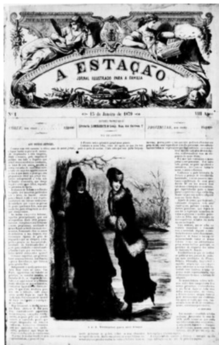
Figura 9. Trajes para frio em janeiro ( A Estação , 15/01/1879).

Verificamos que, apesar de admitirem a existência de um contrassenso no fato de as mulheres brasileiras seguirem com rigor a moda parisiense, os editores não abrem mão da postura um tanto subserviente; contudo, acredito que o esforço em conformar os objetos “às exigências de nosso clima” já demonstra um avanço no que se refere à valorização das especificidades do público leitor brasileiro. Porém, a incoerência do vestuário já é percebida na imagem publicada junto ao editorial, haja vista que indica trajes para o frio em pleno verão brasileiro (Figura 9).