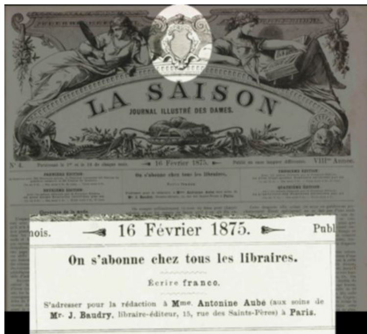
Figura 7. La Saison (detalhe).

Como mencionado anteriormente, tive acesso a apenas uma capa da La Saison : edição para o Brasil, cujo conteúdo corresponde ao da capa da La Saison : journal illustré des dames reproduzido a seguir na Figura 7: