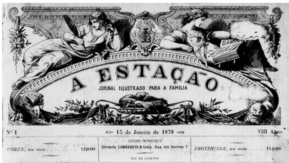
Figura 2. Cabeçalho d’ A Estação .