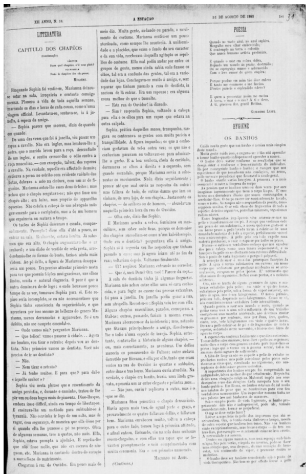
Figura 10. “Litteratura” (A Estação , 31/08/1883).

Devido à relevância que as narrativas seriadas adquiriram durante o século XIX, é natural que a “Litteratura” se firmasse como um dos pilares d’A Estação , sendo uma maneira de atrair a atenção do público leitor e legitimar a parte literária da revista. Além disso, publicar literatura seriada era uma maneira de angariar assinantes, que poderiam se interessar por A Estação para acompanhar o desenvolvimento das narrativas. Duas questões relacionadas à diagramação também revelam a importância da seção “Litteratura”. Em diversas edições, especialmente a partir de 1882 – quando ela passa a, geralmente, abrir o suplemento literário –, o tamanho das fontes tipográficas utilizadas é maior do que o de outras seções, conferindo maior destaque à “Litteratura”. Ademais, comumente os textos da seção eram entrelinhados, recurso tipográfico que consiste no uso de um maior espaçamento entre as linhas, o que possibilita uma leitura mais agradável e confortável. Na Figura 10, verificamos que o conto “Capítulo dos chapéus” é impresso de forma entrelinhada e com fontes tipográficas maiores dos que as empregadas nas seções “Poesia” e “Hygiene”.