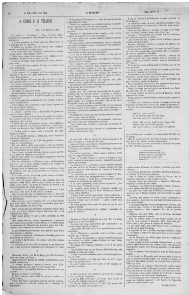
Figura 11. “A cidade e os theatros” (A Estação, 15/04/1884).

conteúdos variavam do teatro à moda, das touradas à Câmara dos Deputados, dos bailes da Corte às mudanças climáticas. E, como uma boa crônica, a tematização da falta de assunto também não poderia faltar.