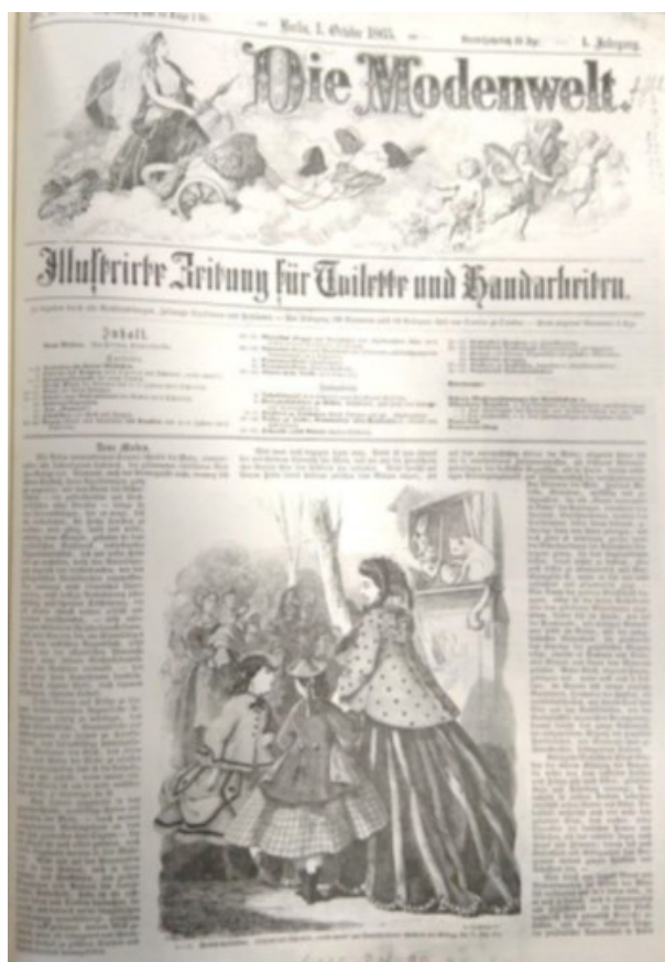
Figura 3. Capa da Die Modenwelt .