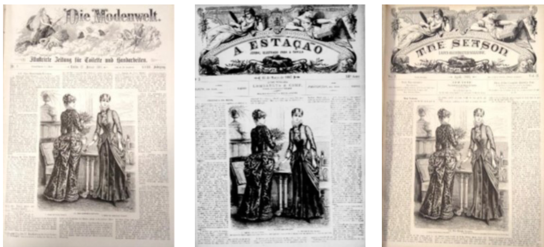
Figura 5 - Comparação de capas: Die Modenwelt (22/01/1883); A Estação (15/03/1883); The Season (04/1883).

Tomando o ano de 1883 como parâmetro, podemos visualizar como diferentes versões da Die Modenwelt eram apresentadas em alguns dos periódicos parceiros (Figura 5).