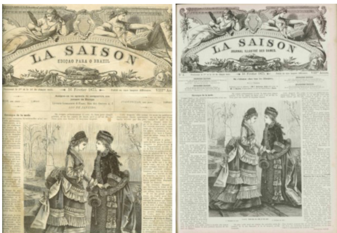
Figura 1. La Saison : edição para o Brasil (16/02/1875); La Saison : journal illustré des dames (16/02/1875).

Os pesquisadores que se dedicaram a estudar a La Saison publicada pela Lombaerts parecem entrar em consenso no que se refere à procedência do periódico: La Saison seria uma revista francesa. Tal afirmação é respaldada por textos dos próprios editores; entretanto, algumas descobertas no decorrer desta pesquisa me levaram a questionar essa premissa, o que será abordado posteriormente neste artigo. Por ora, saliento que, independentemente da origem, comercialmente era mais interessante deixar que as assinantes supusessem se tratar de um periódico francês.