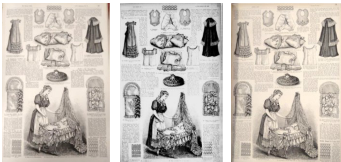
Figura 6. Comparação de conteúdo: Die Modenwelt (22/01/1883); A Estação (15/03/1883); The Season (04/1883)

no período entre 1884 e 1902. Por meio do confronto desse material com as edições disponibilizadas pelo ModeMuseum Provincie Antwerpen (1868, 1869, 1873-1875, 1885-1889, 1892, 1904-1907), observei que, ao menos em determinados períodos, houve duas edições em francês da La Saison , uma belga e outra francesa, com quadros editoriais diferentes, conteúdos que não coincidiam entre si e até mesmo subtítulos diferentes.