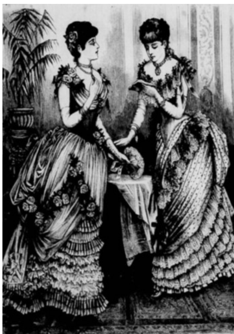
Figura 12. Vestidos de festa.