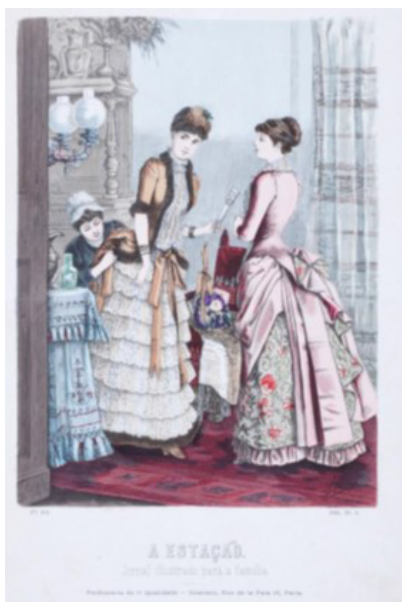
Figura 8. Gravura colorida n' A Estação (30/01/1884).