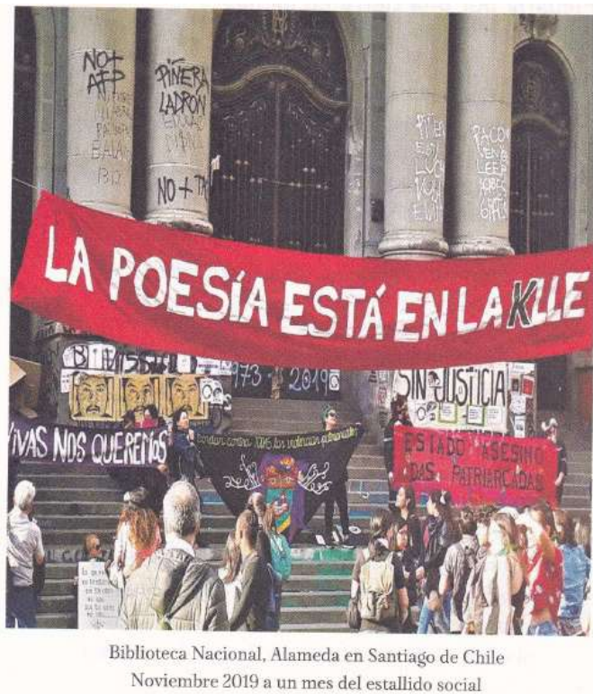
Imagem 6. Fotografia de Busto Castillo que abre a terceira parte do livro

Destaco, nessa parte, o caráter metalinguístico evidente desde a fotografia que a introduz. Ei-la: