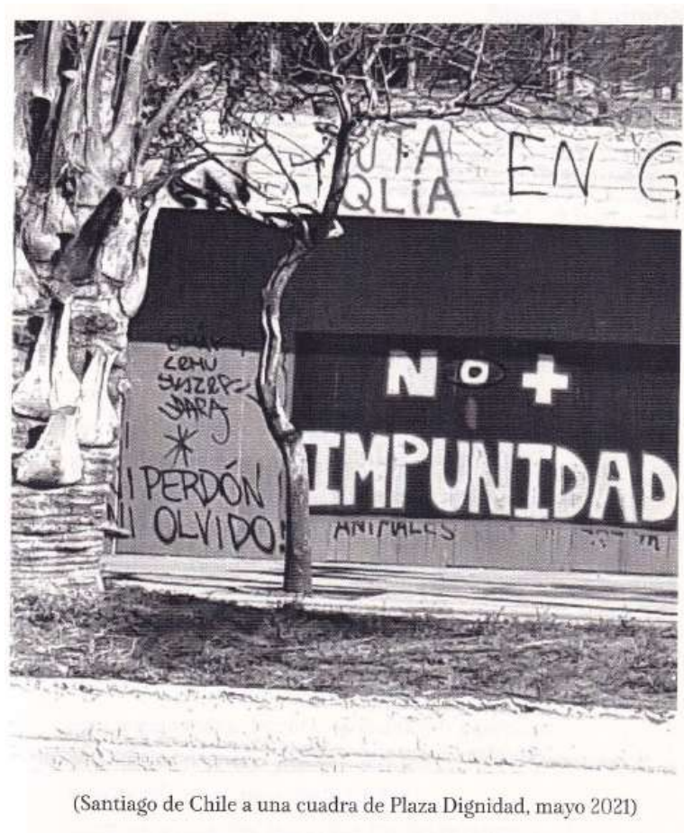
(Santiago de Chile a una cuadra de Plaza Dignidad, mayo 2021)