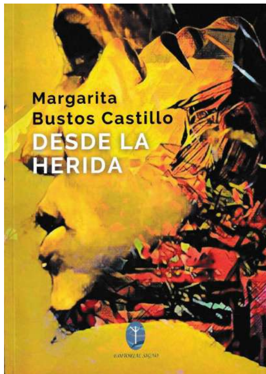
Imagem 1. Capa do livro 8

não se estranha que a relação entre a imagem da capa e o conteúdo da obra seja tão afinada, gerando uma intersemiose que se fará nítida após a leitura dos poemas. O rosto plural da capa, com as cores e os fragmentos que compõem a criação de Etcheverry e que foi percebido por Bustos Castillo como passível de dialogar com o sentido da obra poética, terá seu sentido revigorado ou ampliado pela recepção da fusão entre a poesia e a imagem da pintura. Observemos: