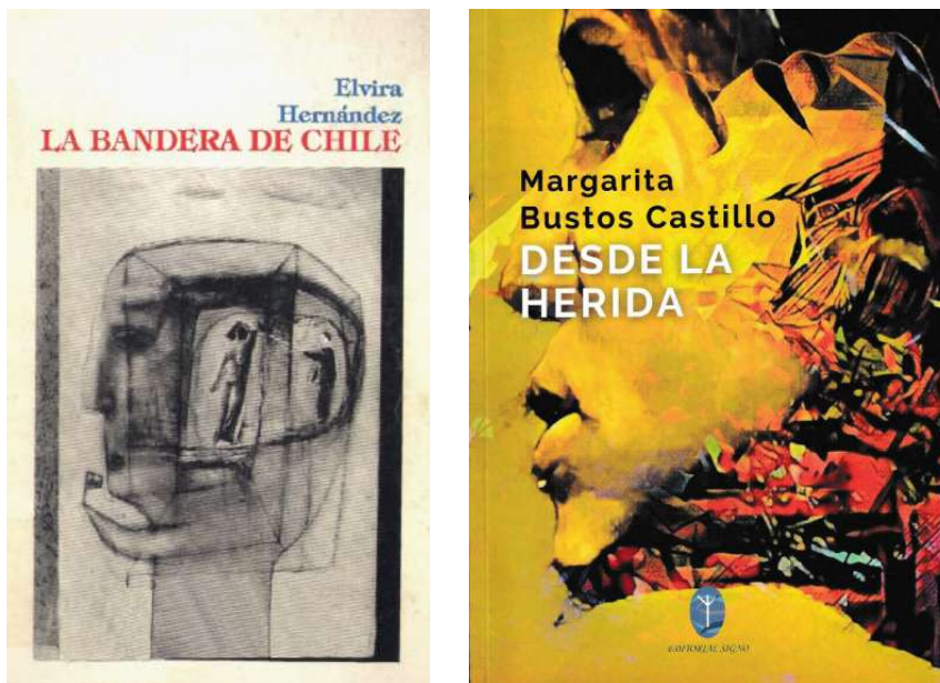
Imagens 2 e 3. Capa de La Bandera de Chile 11 e capa de Desde la herida

Observemos as duas capas para perceber como é pertinente estabelecer associações, ainda que estas não tenham sido explicitamente propostas pela inserção da epígrafe de La Bandera de Chile , de Hernández: