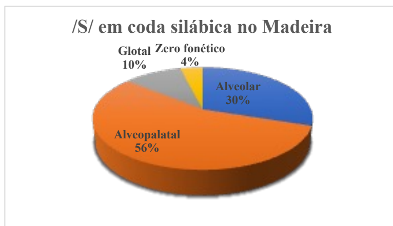
Gráfico 1. Frequência das variantes do /S/ em coda silábica na microrregião do Madeira

De modo geral, foi possível identificar, nas 1000 ocorrências registradas, as quatro realizações fonéticas do /S/ em coda silábica na microrregião do Madeira, conforme destacamos no Gráfico 1.