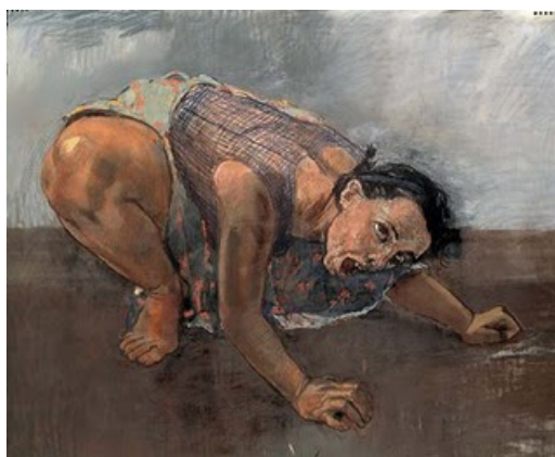
Paula Rego, Mulher-cão , 1994.

Por sua vez, Paula Rego imprime na obra da poetisa uma construção de sujeitos femininos quando compartilha do método dos compostos identitários , como a “mulher-anjo” e a “mulher-cão”, ao passo que Adília se utiliza da imagem da mulher-a-dias para construir a sua própria persona poética. A obra Mulher-cão compõe uma série de quadros feita entre 1994 e 1997, em que Paula Rego escolhe recursos estéticos que utilizam uma figuração pictórica próxima do real e com proporções tridimensionais, apresentando uma mulher sozinha ao centro da obra. A posição corporal é animalésca, a feição facial é disforme e a postura, contorcida e acuada.