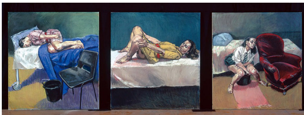
Paula Rego. Tríptico, série Aborto , 1997-1999.