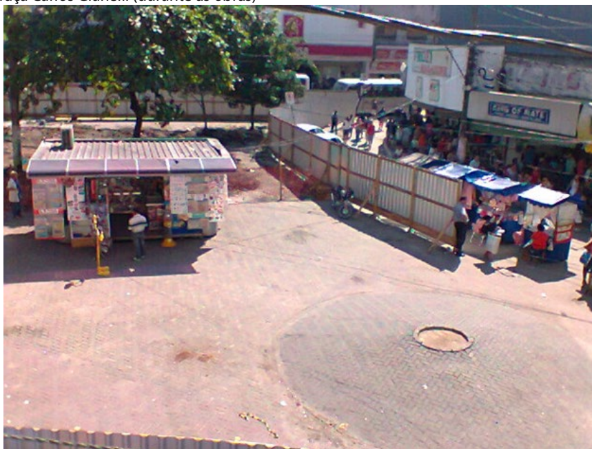
Imagem2:Praça Carlos Gianelli (durante as obras)

Uma marca da história econômica do município relata que ele vem perdendo suas indústrias nos últimos 50 anos. Em seus tempos áureos, São Gonçalo era conhecido como a Manchester Fluminense, em referência à cidade industrial inglesa que concentrava complexos industriais de grande porte e bairros operários. Ainda que essa comparação seja bastante difundida, na contramão dessa desindustrialização o setor de comércio e serviços foi sendo ampliado e diversificado em direção a bairros antes predominantemente residenciais, a exemplo da Rua Albino Imparato, avenida que corta o todo o bairro do Jardim Catarina.