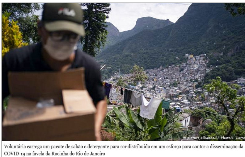
Imagem 6 - Voluntária Levando Itens de Higiene para a Favela da Rocinha

Ainda em relação à parcela vulnerável do corpo social brasileiro, percebe-se, através da Imagem 6, que as ações descoordenadas dos líderes nacionais acarretaram a necessidade que essa parcela teve de se virar por conta própria no ápice da pandemia.