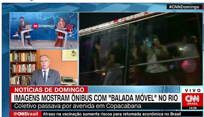
Imagem 3 - Indivíduos se Aglomeram em Ônibus

Com base em Ribeiro (2014) e Holanda (2014), teoriza-se que o brasileiro constituiu a si mesmo através de artimanhas, configurando um certo comportamento arrojado. Tomando isso por base, as Culturas de Indisciplina apontam ainda que o corpo social brasileiro objetiva, através do exercício do seu infrapoder, opções criativas para subverter a ordem estabelecida. A Imagem 3 oferece um exemplo desse contexto.