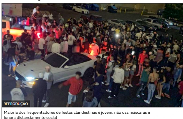
Imagem 4 - Grupo de Brasileiros Aglomera nos EUA Durante a Pandemia

Em adendo, com fundamento na R02 (F01, F02, F03, F04), alguns impactos das dinâmicas políticas e sociais no contexto pandêmico são revelados. Através das relações que R02 possui com a F02, descortinam-se a acentuação dos episódios de xenofobia sofridos por brasileiros e a insegurança internacional que o Brasil ocasionou. A Imagem 4 ilustra esse contexto.