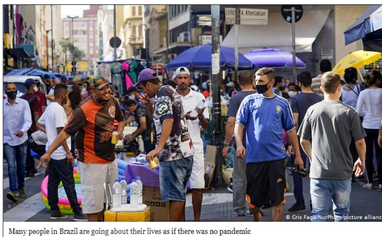
Imagem 5 - Comerciantes Brasileiros em Serviço

A partir disso, percebe-se que esse profundo comportamento indisciplinado do corpo social brasileiro dá suporte também ao individualismo (R03). Através do individualismo, captou-se no contexto analisado a sobreposição dos desejos individuais à saúde coletiva. Assumindo riscos à vida de milhares de indivíduos conforme uma possível “sensação de proteção individual”, o corpo social se expôs ao vírus e, conjuntamente, expôs toda a coletividade consigo. Porém, tais atos não foram apenas empreendidos em conformidade com o individualismo, mas também mediante o desamparo de parcela desse corpo social pelo Estado. Esse contexto é ilustrado pela Imagem 5.