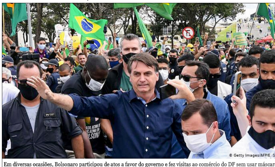
Imagem 7 - Jair Bolsonaro Sendo Indisciplinado

Em diversas ocasiões, Bolsonaro participou de atos a favor do governo e fez visitas ao comércio do DF sem usar máscara