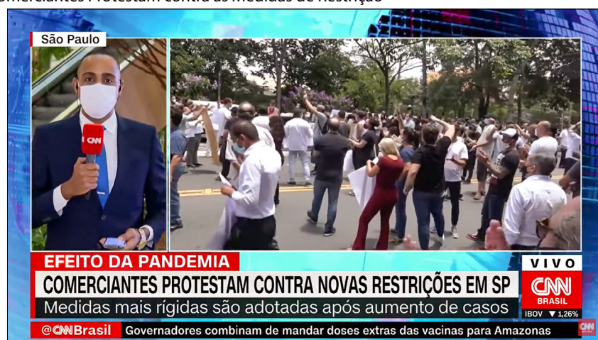
Imagem 8 - Comerciantes Protestam contra as Medidas de Restrição

Diante dessas ações e com fundamento na Imagem 8, indica-se que as medidas de restrição não foram vistas como necessárias por uma parcela do corpo social, mas sim como um ataque às liberdades individuais (F1, F04). Nesse recorte, usando a classe dos comerciantes como exemplo, percebe-se que essa enunciação não passa de uma estratégia de manutenção do status quo e também de faturamento, pois a baixa circulação de indivíduos afetaria os negócios.