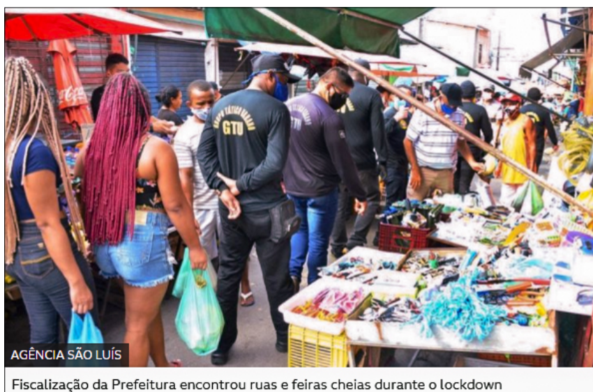
Imagem 1 - Aglomeração Popular em Feira Pública