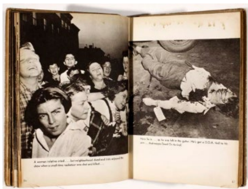
Figura 5: “O primeiro assassinato deles” em Naked City