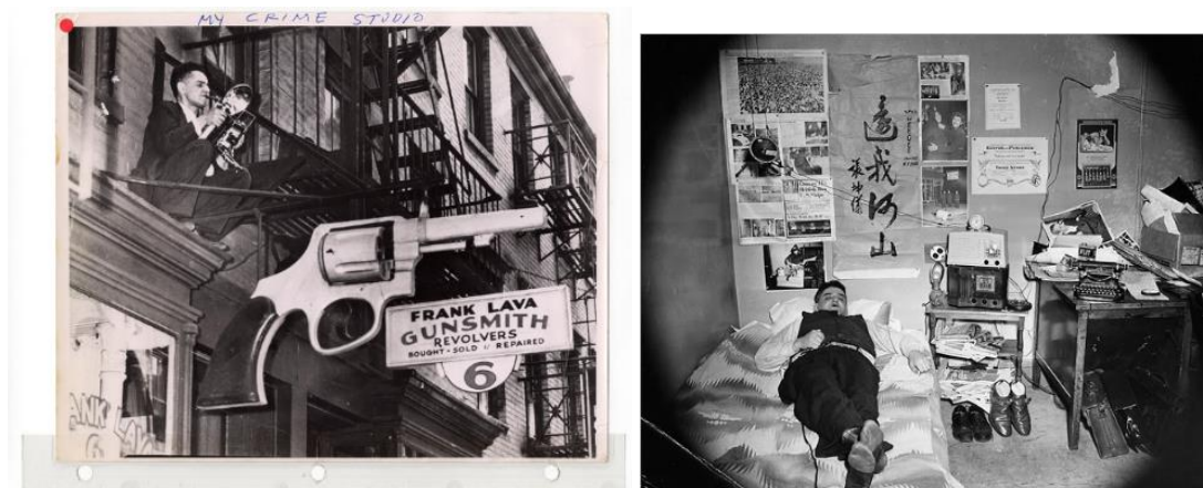
Figura 1: “Meu estúdio do crime”, de Arthur Fellig (Nova York)