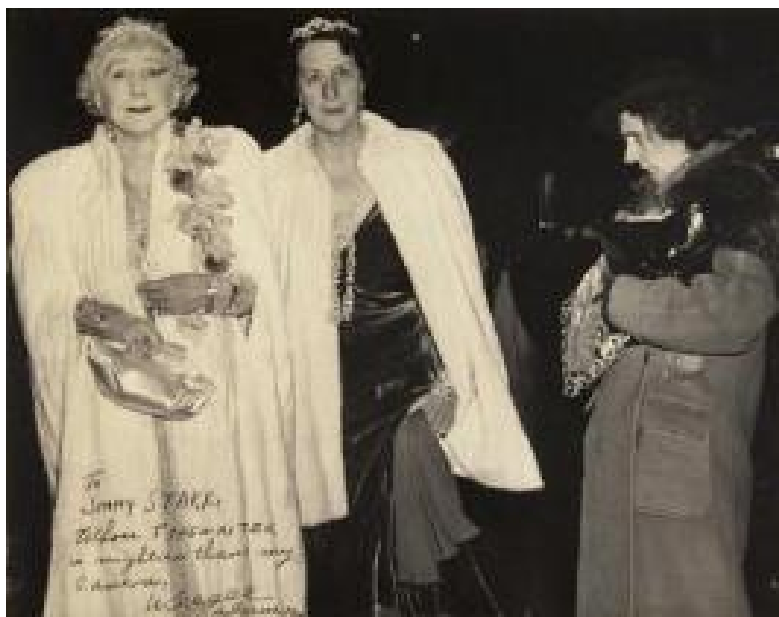
Figura 9: Detalhe de “A crítica” na revista Life