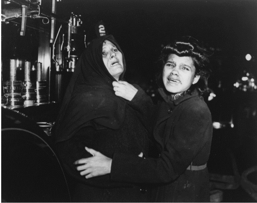
Figura 2: “Eu chorei quando tirei esta foto”, de Arthur Fellig (Nova York)