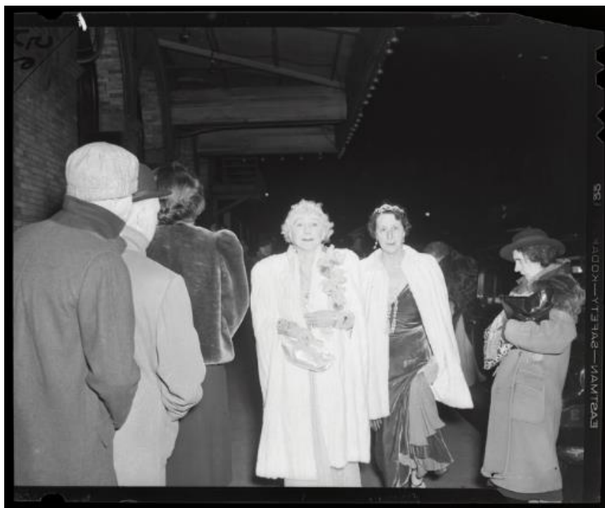
Figura 7: Original de “A crítica”, Metropolitan Opera House, 1943