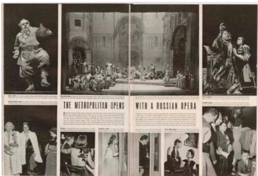
Figura 8: A publicação de “A crítica” na revista Life , dezembro de 1943