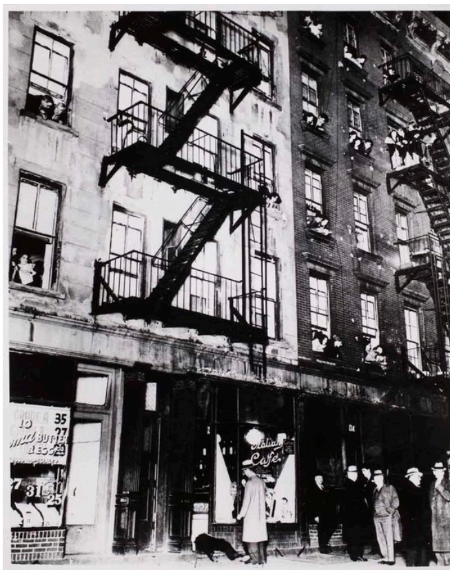
Figura 3: “Lugares na sacada para um assassinato”, de Arthur Fellig (Nova York)