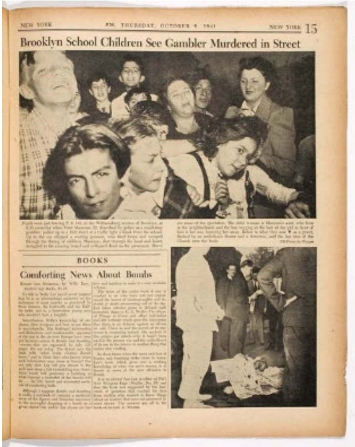
Figura 4: “O primeiro assassinato deles” no jornal PM Daily

Weegee tinha permissão para criar foto-histórias no PM Daily , nesse caso, abaixo da foto principal, havia outra com o corpo do apostador morto e transeuntes ao redor. Na “fabricação” realizada para o Naked City (Figura 5), a página à esquerda mostra a foto principal e à direita está um recorte da segunda foto, destacando o cadáver. As legendas abaixo de cada foto dizem, respectivamente: “Uma parente chorou..., mas as crianças ao redor daquele beco sem saída gostaram do espetáculo, quando um reles trambiqueiro foi baleado e morto” 15 e “Aqui está ele... como foi encontrado na sarjeta. Ele ganhou um E.M. amarrado em seu braço... E.M. significa “encontrado morto”. 16