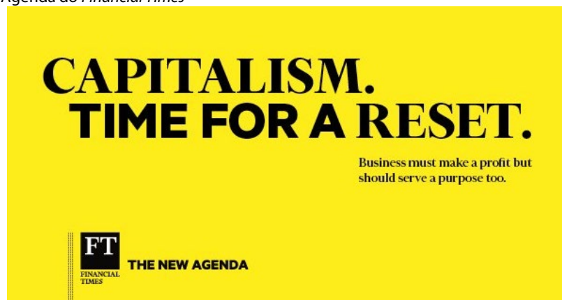
Figura 1: A Nova Agenda do Financial Times

E m setembro de 2019, o Financial Times (FT), jornal britânico de economia e negócios, porta-voz do setor financeiro e baluarte do capitalismo de livre-iniciativa, lançou uma nova campanha editorial, a maior desde a crise de 2008: