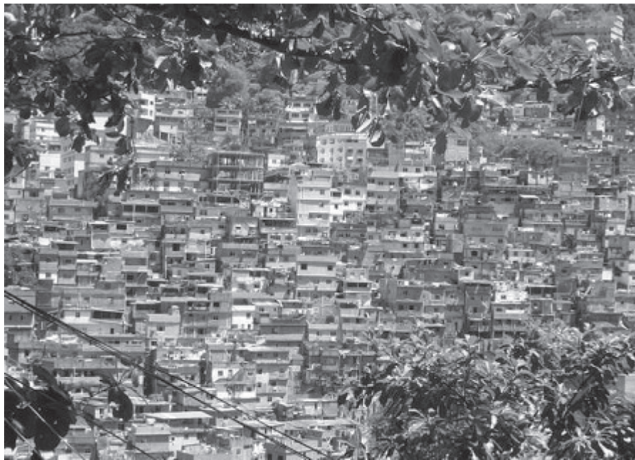
Figura 1 - Vista de trecho da Rocinha. Fotografia tirada só setor chamado "Roupa Suja", um dos mais precários da favela.

muito além do seu caráter instrumental. Ainda que fosse necessário tomar alguma precaução para não infringir códigos de comportamento não escritos, nestes locais era possível circular sem a companhia do "guia", o que representava a garantia ao direito de ir e vir de qualquer pessoa (Gomes, 2002; Sennett, 1998).