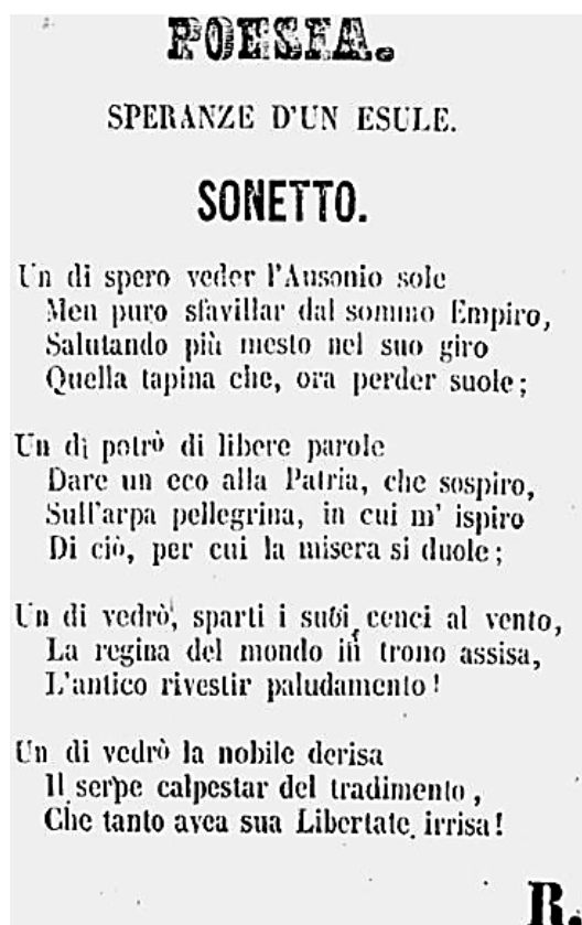
Figura 2: Poesia “Speranze d’un esule”, publicada em 02 de julho de 1854, p. 2.

Ainda no número de estreia, o redator publicou um poema (Figura 2), aparentemente de própria autoria (apenas assinado “R”), que foi seguido da publicação do Canto I do Inferno da Divina Comédia no original em italiano e na versão para o português, feita pelo latinista António José Viale. O canto foi utilizado em uma sessão pública de declamação e improvisação.