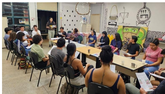
Figura 5: Encontro do grupo de pesquisa Naldeia sobre o Tehêy