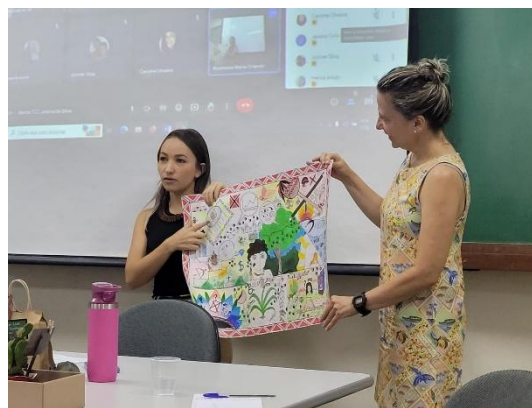
Figura 7: Apresentação de Tehêy em TCC de estudante indígena na Ufscar