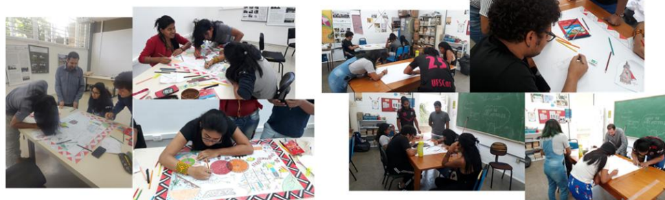
Figura 4: Momentos da confecção do tehêy da tese citada

O preenchimento dessa ficha é facultativo, sendo etapa anterior ao desenho do tehêy, podendo ser usada para facilitar a organização das ideias e a definição de quem fará o quê. Pode também ser realizada oralmente e nunca devendo substituir a confecção do tehêy desenhado e pintado. Em nossa vivência usando a metodologia do Tehêy, percebemos que alguns grupos tiveram mais facilidade usando a ficha, especialmente na primeira vez em que o tehêy é feito pelos(as) participantes, enquanto nos grupos em que pelo menos uma das pessoas já havia utilizado essa metodologia essa etapa de organização foi oral.