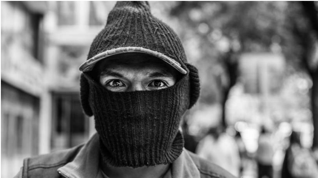
Fotografia 4: El Babas (2015)