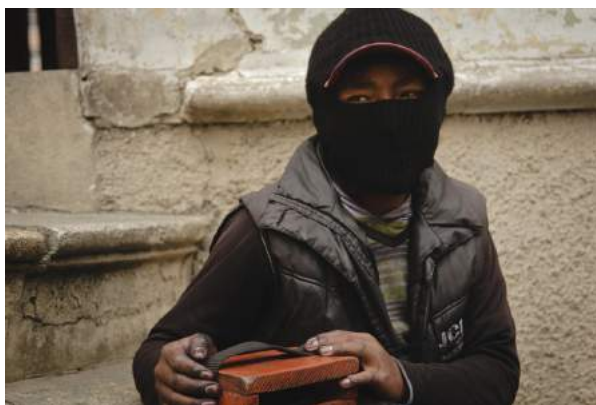
Fotografia 1: Lustrabotas (2014).