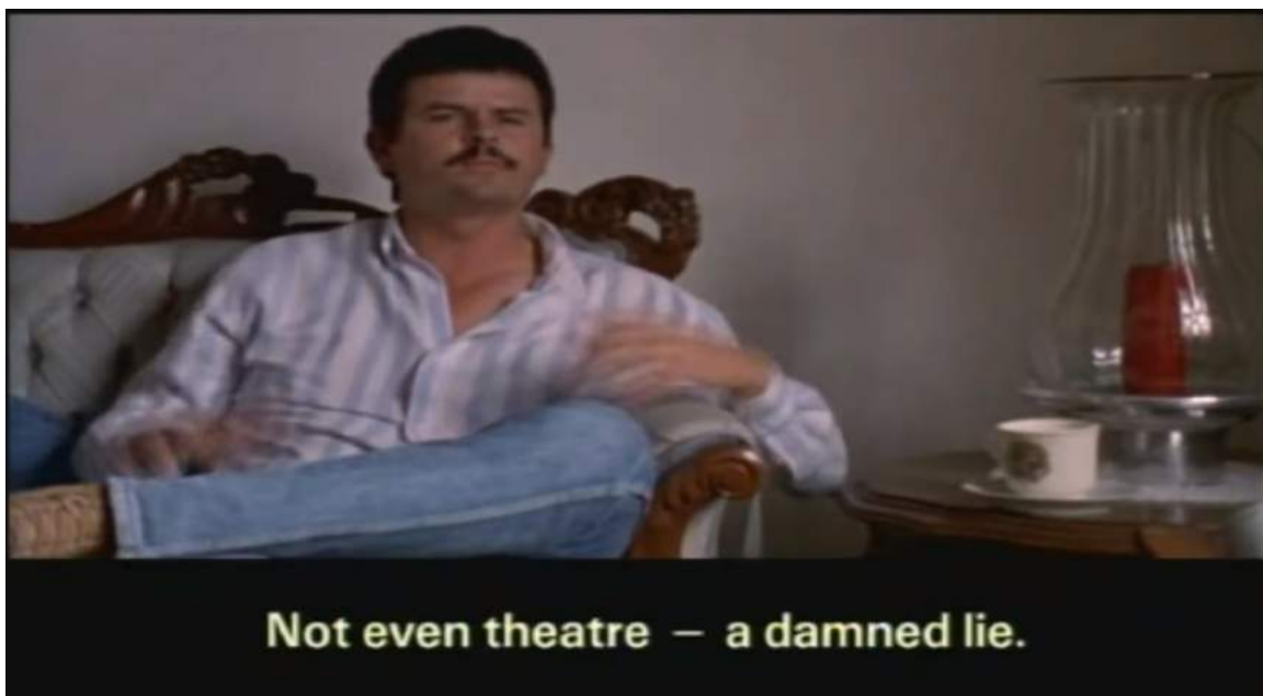
Imagem 1: Finquero Canter sendo entrevistado em Um lugar chamado Chiapas (1998)

“Você acha que é apenas um teatro?” continua Wild. “Não” responde novamente o finquero . “Para mim é uma farsa. Nem sequer teatro, é uma maldita de uma mentira” conclui, sem perceber os possíveis desdobramentos dessa recusa radical ao diálogo.