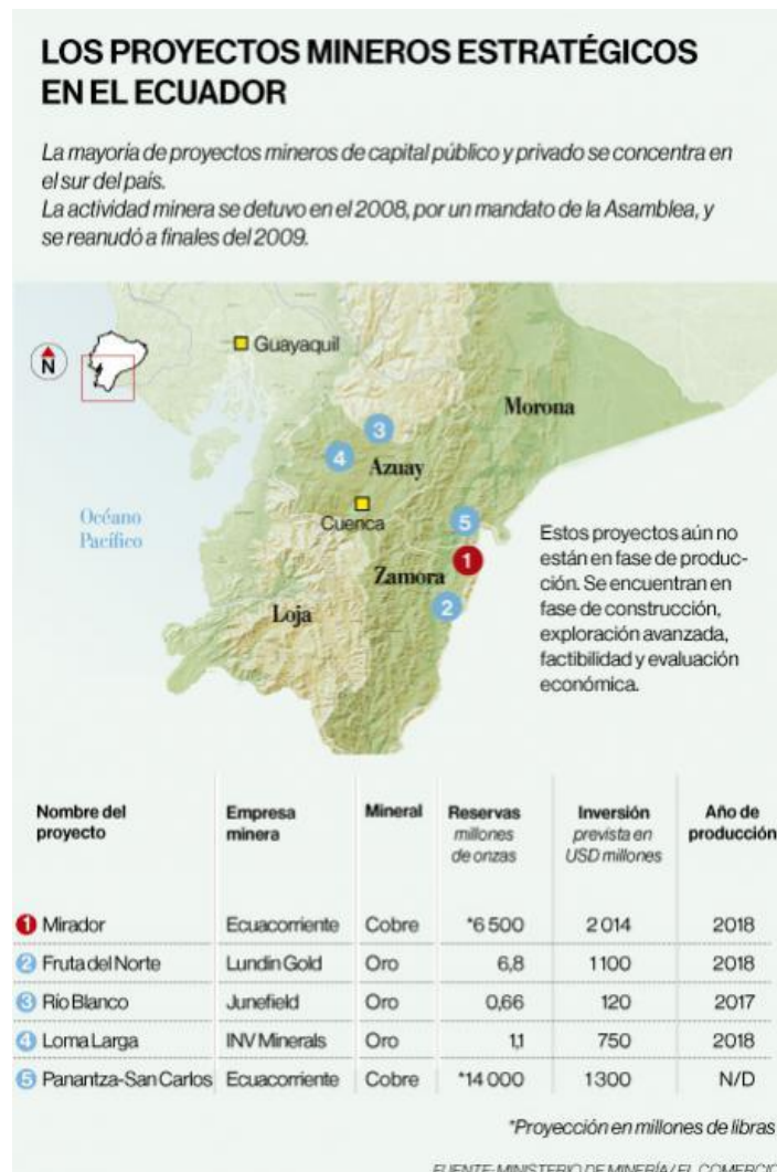
Imagem 4: Projetos minerador no sul do Equador

Na cordilheira do Condor, zona de altíssima biodiversidade e lar do povo Shuar-Arutam, o Estado equatoriano tem três projetos de mineração de grande escala a céu aberto: Fruta del Norte, Mirador e San Carlos Panantza.