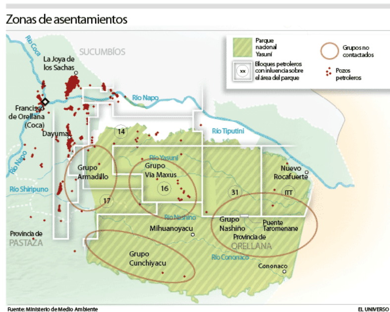
Imagem 3: Zona de exploração e observação de povos livres