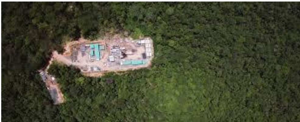
Imagem 1: Vista aérea do acampamento de Pañacocha

A transição da norma para sua aplicação foi mais difícil do que o esperado. Hoje, 10 anos depois de proclamar o Bem Viver como um futuro desejável, 15% do território nacional está cedido às mineradoras públicas e privadas; estamos vivendo, pela primeira vez a mineração em grande escala, afetando territórios indígenas (por exemplo, o projeto San Carlos Panantza no território Shuar) e fontes d'água (como no caso da mina do Rio Branco e Quimsacocha na província de Azuay), assim como a expansão da fronteira petrolífera até áreas de extração extrema, como é o caso das reservas de óleo extrapesado de Yasuní ou a difícil recuperação em um complexo pântano como o de Pañacocha.