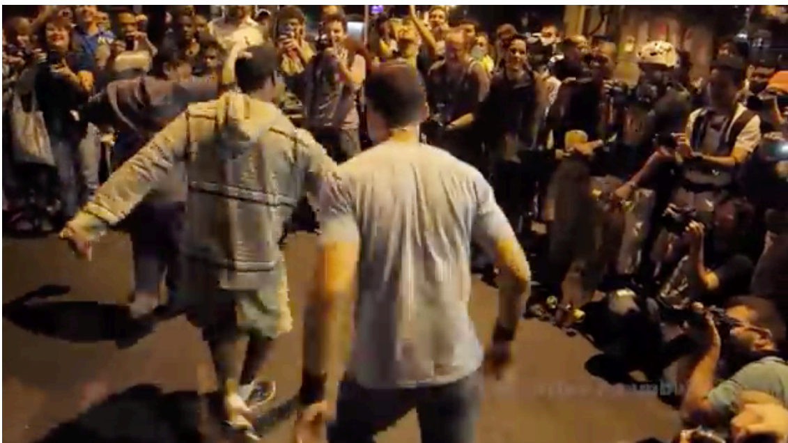
Figuras 2 e 3: frames do vídeo “Fellini na Manifestação de 11 de Julho • The Fellini's Cut on Rio 11, July Demonstration”, de Carlos Azambuja. Protesto na Cinelândia, RJ. Disponível em https://www.youtube.com/watch?v=iKIZRVN6rrg

A.N.: Sobre as imagens que me mostraram... A primeira era de uma grande manifestação, da multidão, muitas cabeças e todos ali, e diante dela tem esta linha armada, capaz de abrir fogo, e aí, continuando com a imagem, vemos que a multidão diante do poderio de fogo se articula, tem um rapazinho que dá o dedo do meio à polícia, ele está abaixado atrás de um escudo ou algo do gênero, tem o fato sobretudo que essa multidão não é simplesmente potente ou massificada, é uma multidão que dança, é o que dizíamos antes, o fato que a multidão que luta junto tem conexões afetivas, exatamente expressões corporais.