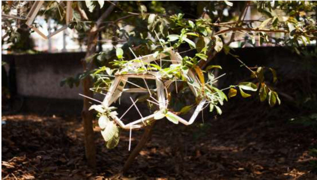
Figura 3. Luminária crescendo sobre molde instalado em goiabeira

O projeto Celulose Bacteriana (Costa e Biz, 2017) trata do desenvolvimento de um eco-compósito, que é assim chamado quando os materiais componentes de um compósito (fibras e matriz) respeitam as metas ambientais, podendo ser de origem vegetal, derivados de fontes renováveis ou não, devendo ser atóxicos e abundantes. As duas fases podem ser biodegradáveis ou apenas uma delas, sendo que, no caso em que ambas as fases são biodegradáveis, são conhecidos como bio-compósitos (Schuh e Gayer, 1997).