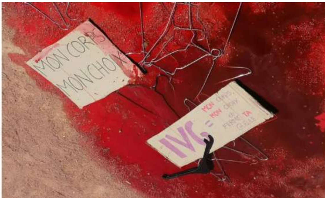
Figura 3: Cabides durante a manifestação pelo direito ao aborto no sábado, 2 de julho de 2024, em Lyon. Na imagem diz: “Mon corps, mon choix”, em português “Meu corpo, minha escolha.