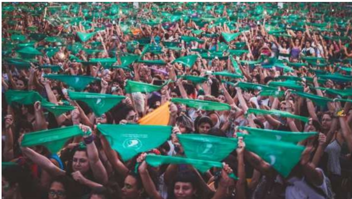
Figura 5: Marcha pela legalização do aborto em Buenos Aires, em 2018.

expressividade mundial, foi um grande debate na Argentina. E o cabide estava sendo utilizado como símbolo, porque esse símbolo dialogava com o público para onde estava direcionado esse anúncio, que era o Norte Global, que era Nova York, que eram os Estados Unidos. Mas, em terras latinas, outras coisas estavam acontecendo (Figura 5).