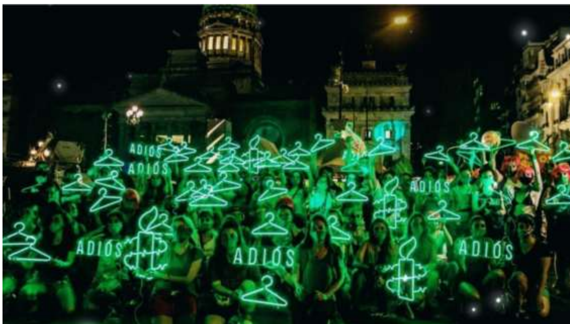
Figura 10: Iniciativa performática da Anistia Internacional na Vigília em 2020.

Esses artefatos, que são visuais e materiais e são produzidos na coletividade da luta dos movimentos sociais, carregam conhecimentos e histórias que estão neles incorporados e que desafiam as narrativas dominantes sobre essas lutas. E voltando, em 2018 elas perderam no Senado, mas elas ganharam o debate na sociedade. Por quê? Porque era um mar de gente com lenço verde, você botava o lenço na mochila, você botava o lenço no punho, você levava o lenço para casa. O lenço era motivo de debate. O aborto conseguiu ser falado na mesa de bar e na mesa de almoço com seus pais, e isso tudo tem a ver com esses elementos, com essas criações que levam a essas histórias, que levam a esse debate, que potencialmente politizam a população a partir dessas materialidades e dessas narrativas que estão sendo criadas. Da denúncia ao anúncio.