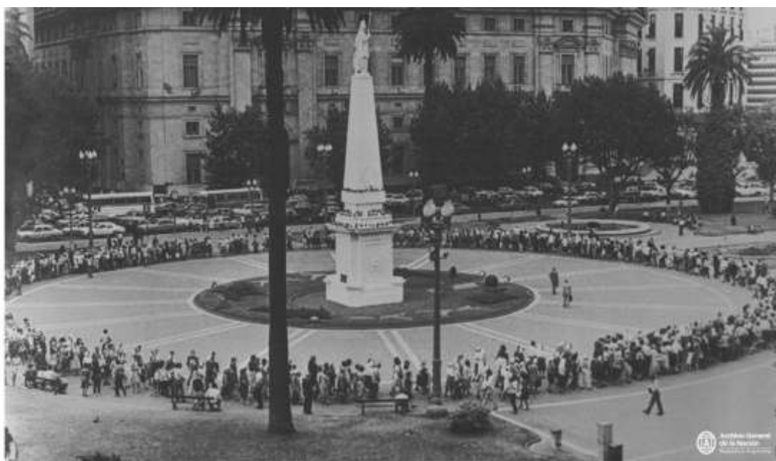
Figura 7: Ronda das Mães da Praça de Maio em 1979.

O lenço tomou outras proporções, elas passaram a bordar esses lenços com o nome dos seus filhos desaparecidos, e elas passaram a customizar esses lenços de diversas formas para os seus protestos, todas as quintas-feiras elas faziam voltas ao redor da Praça de Maio, em frente à Casa Rosada, que é a sede da presidência da República Argentina (Figura 7). E aqui não são só mães, depois de um tempo, a população começou a se juntar a essas mães, a fazer essas rondas, a fazer essas voltas na frente da Casa Rosada. Então, o lenço tomou um significado e um protagonismo na luta dessas mulheres, que também foi imbuído de um sentido político e sintetizava essas práticas políticas que elas tinham.