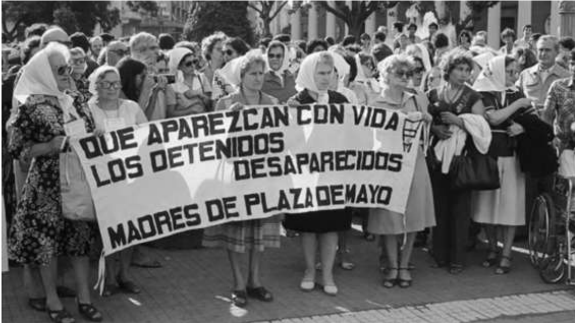
Figura 6: Marcha das Mães da Praça de Maio em frente à Casa Rosada, em 1977, ano da fundação do coletivo. Na faixa, lê-se: Que aparezcan con vida los detenidos desaparecidos. Em português: Que apareçam com vida os detidos desaparecidos.

Esse lenço, gente, originalmente não era um lenço, era uma fralda. Em entrevistas (Minissérie, 2015), as Mães da Praça de Maio falam que foi bastante inusitado a forma como elas chegaram nesse elemento. Elas estavam indo a peregrinação de uma santa em uma região próxima de Buenos Aires. Essa peregrinação junta milhares de pessoas e elas pensaram: a gente precisa de algo para se identificar na multidão para a gente poder se juntar. O que a gente vai usar? E aí elas pensaram, todas nós temos fraldas brancas em casa, porque nós precisávamos cuidar dos nossos filhos e dos nossos netos. Quem sabe a gente leva essas fraldas e a gente se localiza. No começo elas nem estavam pensando em usar na cabeça, elas estavam pensando em usar na mão, mas elas também não tinham condição de ficar o tempo todo com a mão levantada. Isso é elas contando, gente, a minissérie está toda disponível no YouTube. E então elas resolvem amarrar esses lenços na cabeça, e isso realmente era uma postura inusitada para aquela peregrinação. Depois deste dia, isso passou a ser um elemento tanto de identidade, para que elas se reconhecessem nas multidões, mas também de uso no dia a