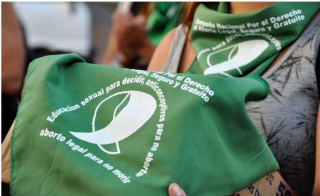
Figura 8: Lenço verde pela legalização do aborto. Com desenho de um lenço branco e a frase, em espanhol: Educación sexual para decidir, anticonceptivos para no quedar embarazada y aborto seguro para no morir. Em português: Educação sexual para decidir, contraceptivos para não engravidar e aborto seguro para não morrer. Fonte: Autoria Desconhecida. La Izquierda Diario.

E aí a gente chega no lenço verde. Esse ano, faz 20 anos, que o lenço verde é utilizado como elemento da luta pelo direito ao aborto na América Latina. Isso começou lá na Argentina. As argentinas fazem um encontro nacional de feministas todos os anos desde 1986, e há 20 anos foi instituído nesse encontro o uso do lenço verde como elemento de luta.