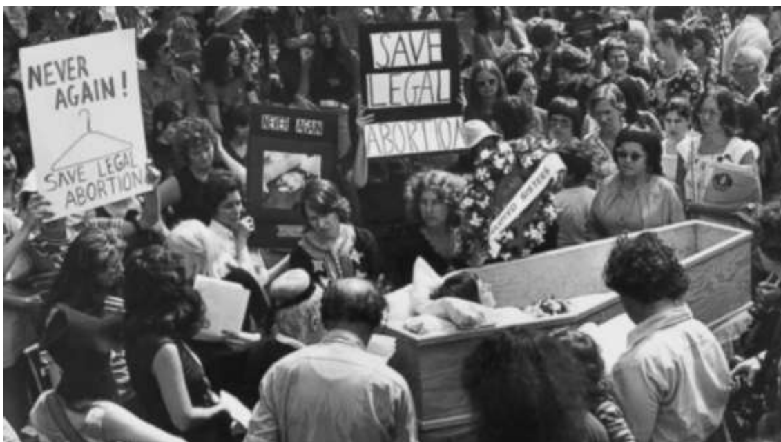
Figura 1: Imagem de cabide em cartaz em manifestação de 1973 sobre a decisão da Suprema Corte de Roe x Wade.