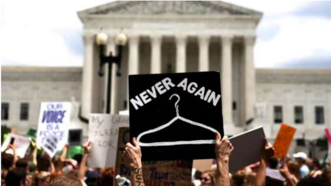
Figura 2: Manifestação contra a revogação de Roe v Wade sobre o aborto, em Washington, 24 de junho de 2022. Na placa lê-se "Never again". Em português: Nunca mais.

interromperem a gestação em todo o território nacional. Com essa decisão de 2022, hoje cada estado define leis específicas por conta da organização federativa do país, e muitos estados estão proibindo, mas a metade dos estados já não realizam procedimentos de aborto e está realmente um caos, banimento total em alguns lugares.