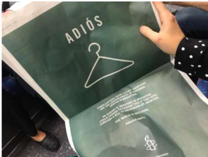
Figura 4: Anúncio da Anistia Internacional sobre aborto na edição internacional do The New York Times, que diz aos membros do Senado da Argentina que “o mundo está observando”.

Agora a gente vai viajar um pouco lá do Norte Global para a América Latina (Figura 4). O que essa página de jornal diz? Ela diz “Adiós”, que é adeus. Então “adeus, cabide”. Por quê? Esse é um anúncio da Anistia Internacional no New York Times em 2018 quando a Argentina estava votando a legalização do aborto, depois de muitos anos de luta.