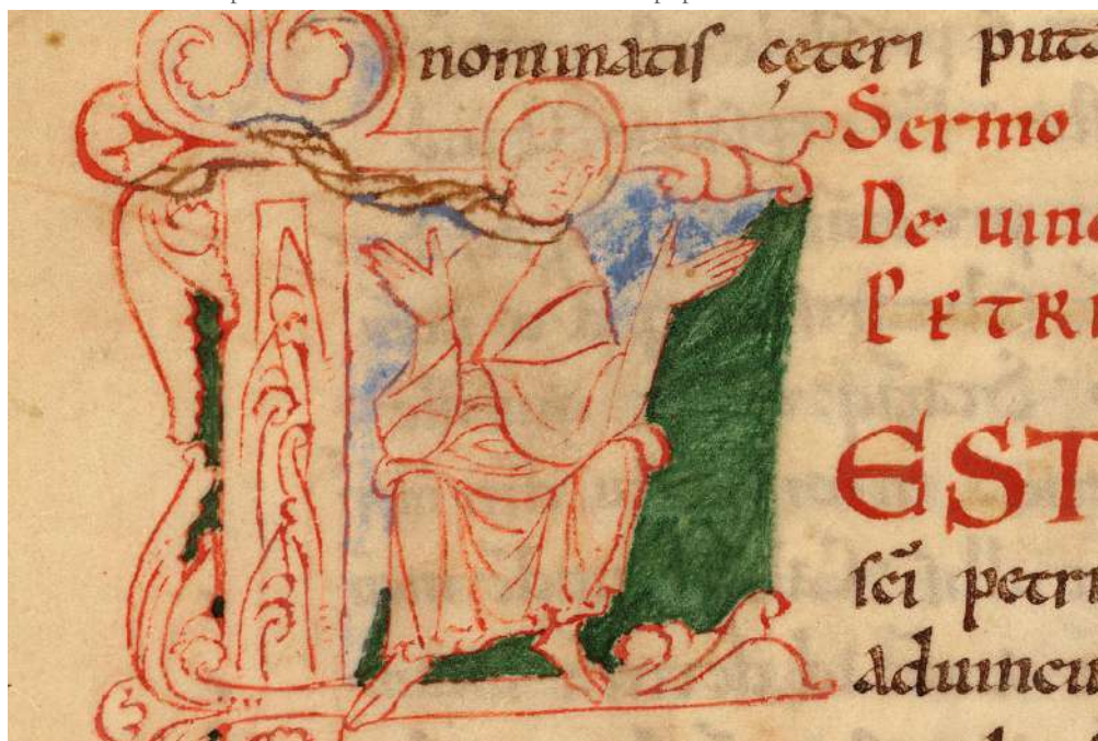
Figura 3 – Detalle del folio 165v del manuscrito Ms528 de Cambrai. https://bvmm.irht.cnrs.fr/consult/consult.php?VUE_ID=1294794 .

Fuente: BVMM – Bibliothèque Virtuelle des Manuscrits Médiévaux.