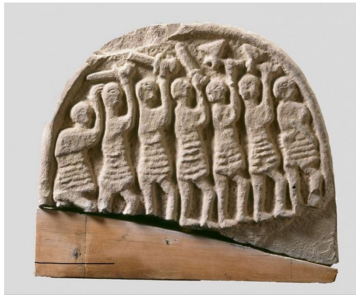
Figura 2: Lindisfarne Stone também conhecida como: Viking Raider Stone.