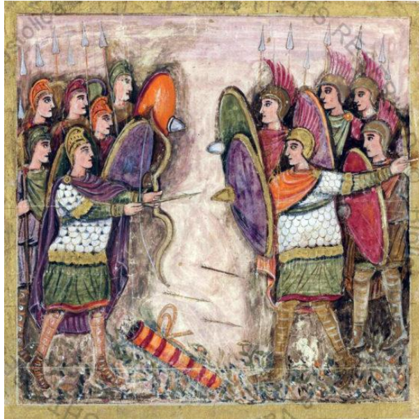
Figura 1: A batalha de Orleans, 463 d.c.

por sua vez, poderiam ser usados para encomendar objetos de luxo de adorno pessoal de artistas locais.