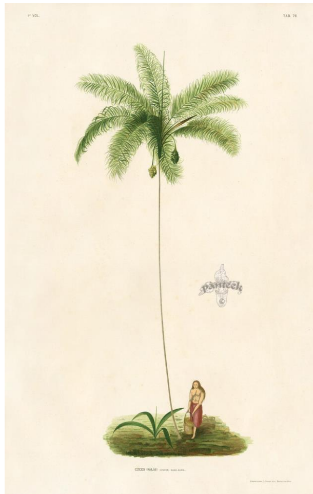
Figura 3: Cocos Inajai: Sertum Palmarum Brasiliensium, Ilustração de João Barbosa Rodrigues, 1903.