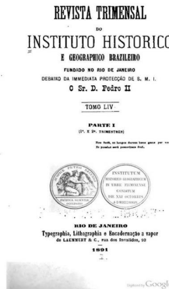
Figura 1: Capa da Revista Trimestral do IGHB de 1891.

Nesse período o estado buscava a compreensão de como construir a identidade nacional do Brasil, história e ficção vão se misturar mesmo que apresentando incoerências historiográficas, a fim de consolidar e criar a cultura nacional de nosso país, os romances do conto de fundação de uma nação como parte da perspectiva literária da época impulsionam as diversas teorias sobre as questões étnico raciais do Brasil, afim de justificar um presente apontar as direções para o futuro do território nacional, não à toa os homens/narradores do estado da época buscam pela romantização da nacionalidade brasileira que acaba por se tornar a verdade histórica do período (CASTORIADES, 1982).